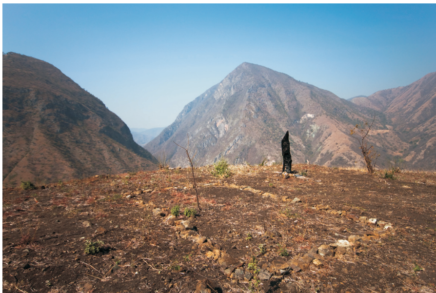
Figura 1. El conacaste quemado.