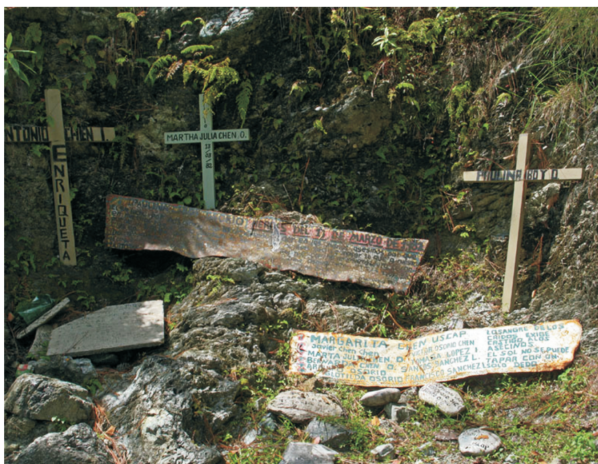
Figura 2. Sitio de memoria en Pak'oxom.