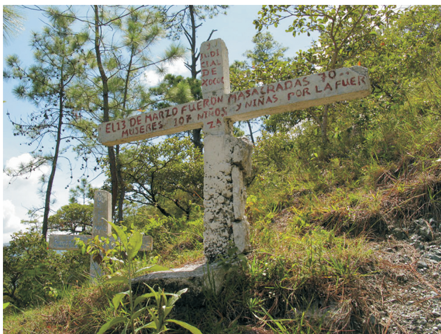
Figura 3. Cruz con inscripción en Pak'oxom.

El ejemplo de Río Negro muestra cómo la integración de elementos de la historia reciente en la memoria cultural funciona en favor de un proceso de “localización” de la identidad étnica. Los elementos de origen más reciente de la cultura en Río Negro, es decir, la conmemoración ritual de las víctimas de las masacres y el establecimiento de sitios de memoria, distinguen a su población, por ejemplo, de la mayoría de los habitantes rabinalenses de la cabecera municipal que, aunque familiarizados con los hechos históricos, no comparten estos rasgos a nivel cultural. Así surge una identidad étnica local basada en rituales y sitios de memoria que obtienen un significado dentro de una comunidad muy restringi-