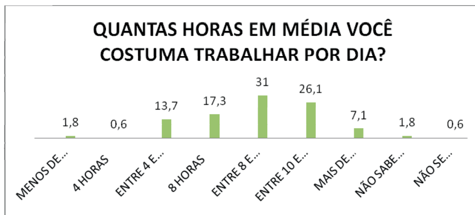
Gráfico 3 – Horas de trabalho diárias