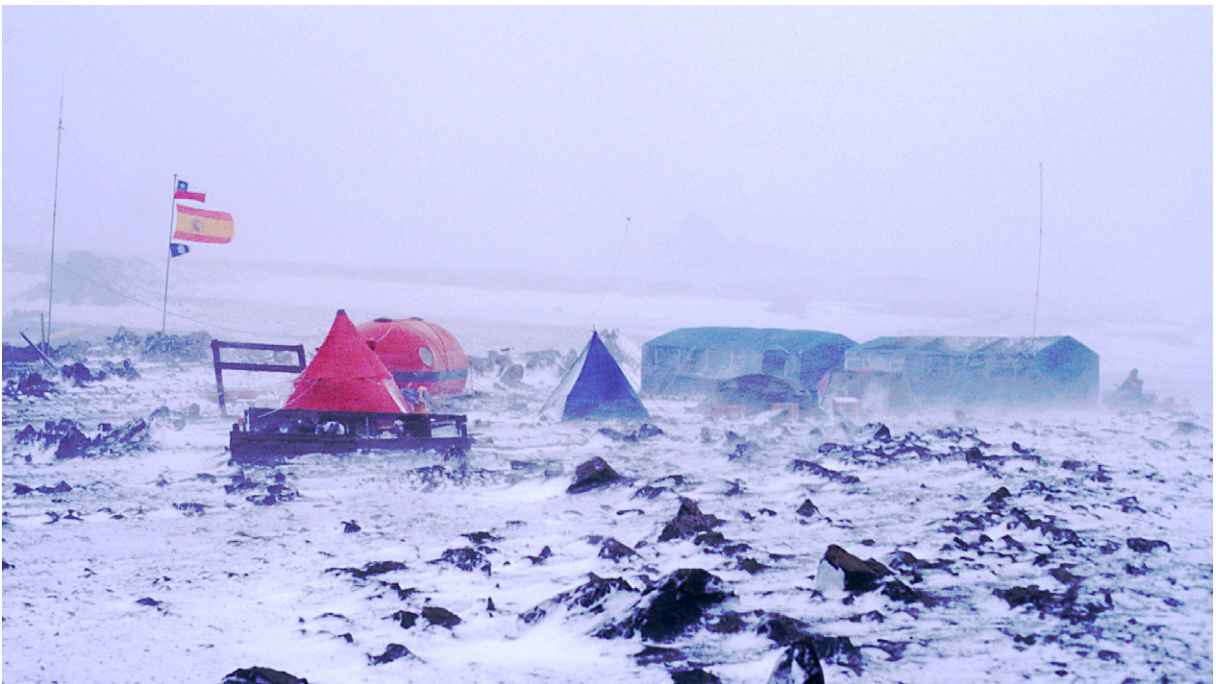
Figura 4. Proyecto San Telmo (Antártida). Campamento conjunto en Cabo Shirreff (Isla Livingston). Universidad de Zaragoza e INACH (Chile) en 1994. Fot. MMB.

La Universidad de Zaragoza colaboró desde su implantación a inicios de los años ochenta con las AULAS DEL MAR, nacidas al amparo de la Armada Española, la ciudad de Cartagena y otras instituciones en 1985 36 . A nosotros se nos encomendó la dirección del Aula de Arqueología Subacuática. Posteriormente cuando estas enseñanzas fueron absorbidas por la Universidad de Murcia con la denominación de Universidad del Mar y la participación de la Nueva Universidad Politécnica de Cartagena, seguimos compartiendo en este caso la dirección con la Universidad de Murcia (Ramallo-Martín-Bueno) hasta que han decaído. Igualmente colaboramos en las Jornadas de Arqueología Subacuática organizadas por la Universidad de Oviedo en los años ochenta 37 que no pasaron de cuatro ediciones, y con otras universidades como Madrid (UAM) 38 y sobre todo Valencia, que continúa con