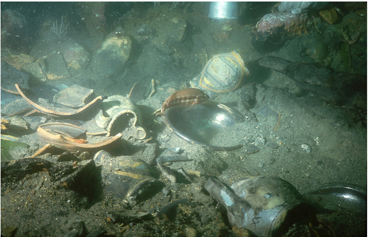
Figura 2. Excavación en Getares (Algeciras) en 1982.

En Zaragoza la existencia de un Regimiento de Pontoneros del Ejército de Tierra, con una compañía de Actividades Anfibias, que luego evolucionaría hasta su situación actual, fue también un acicate para el fomento de este tipo de prácticas, el buceo asociado a la pesca y desde luego también a la introducción del buceo con escafandra autónoma, que iba a permitir ir mas allá. La combinación de la existencia de estas instalaciones, la de la creación de la FZAS y de CADAS y otros clubes mas tarde, junto a la existencia de una Universidad prestigiosa con posibles receptores de una idea y unas actividades con las que extender la práctica científica en la vertiente docente e investigadora, fue el detonante sin duda para que nuestra ciudad se convirtiese en la pionera en la introducción de la Arqueología Subacuática en el cursus de la licenciatura de Filosofía y Letras, donde se impartía la Historia y en ella la propia Arqueología. Ello junto al hecho de que en nuestra persona se daba la doble condición,