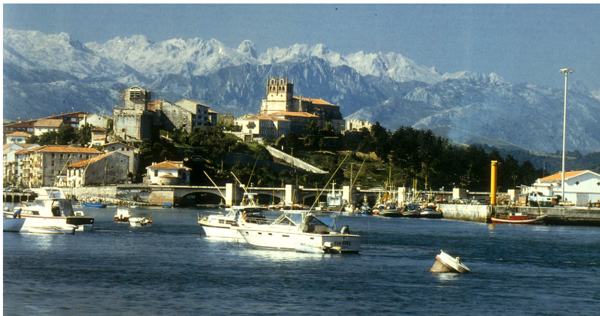
Figura 5. San Vicente de la Barquera (Cantabria) 1986.

La universidad de Zaragoza ha participado por medio de Manuel Martín-Bueno en tareas de definición y redacción de normas tanto nacionales como internacionales en: Consejo de Europa 41 , UNESCO (Convención 2001 para la Protección del PCS) 42 , Gobierno de España, Ley 16/85 del PHE, Gobierno de Aragón, Ley del Patrimonio Cultural Aragonés, Proyecto de Ley para el Gobierno de la ROU, y otras cola-