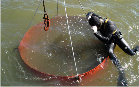
Figura 3. Puerto de Montevideo (ROU) en 2005. Campana para excavación en fondos de lodo.

En los proyectos aludidos se ha colaborado con instituciones y estructuras nacionales y extranjeros como: