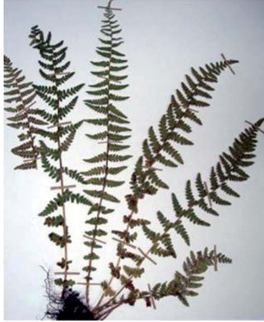
Fig. 2. Esporofito adulto de Woodsia mollis . La escala corresponde a 1 cm.