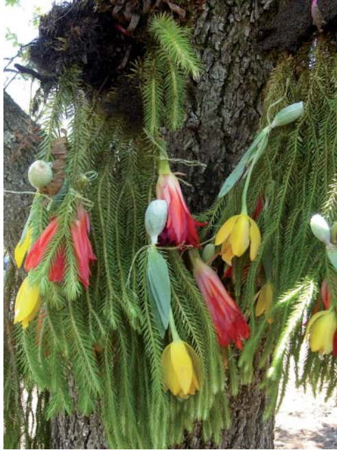
Fig. 2. Ramillete elaborado con ejemplares de Disocactus ackermannii , Huperzia sp. y Prosthechea karwinskii .

a) Ramilletes hechos con una planta completa de disciplina, seis flores de lirio amarillo y otras seis de junco rojo; son los adornos más frecuentes y se colocan en las paredes y altares de las iglesias (Fig. 2); el número de ramilletes en cada barrio varía de acuerdo a la disponibilidad de plantas, pero se observó que va de 10 a 40. Cuando la floración del lirio amarillo no coincide con la Semana Santa, en los ramilletes esta planta es sustituida por frutos de granadilla, que también son de color amarillo.