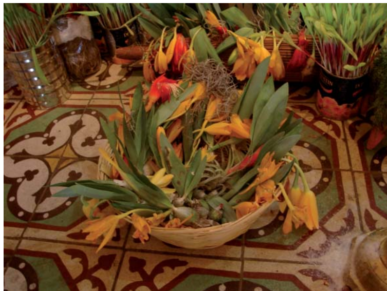
Fig. 5. Canasto de carrizo con ejemplares de Prosthechea karwinskii en el interior de la capilla del barrio La Soledad, Zaachila.