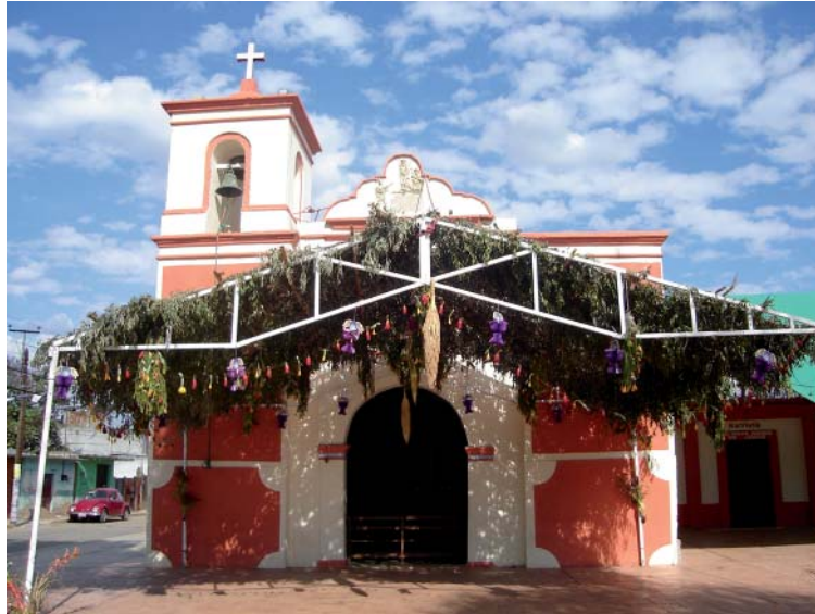
Fig. 6. Ramada hecha con hojas de Dodonea viscosa (jarilla) colocada al frente de una capilla, debajo de ella se observan ramilletes, guirnaldas y en la parte central tres inflorescencias de Phoenix dactylifera (palma datilera).

cerca de 200 flores tanto de lirio amarillo como de junco rojo.