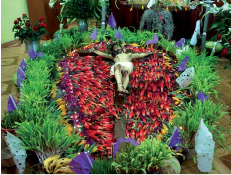
Fig. 3. Lecho del Cristo elaborado en la capilla del barrio La Soledad, Zaachila.

c) Tocados para sombreros, hechos con igual número de flores de lirio amarillo y junco rojo (cuatro a cinco) montadas sobre una mata de heno blanco que se colocan sobre sombreros de palma y son obsequiados a los miembros del comité organizador de cada barrio (Fig. 4).