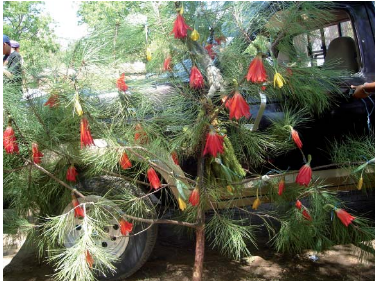
Fig. 7. Rama de Pinus aff. teocote adornada con flores de Disocactus ackermannii y Prothechea karwinskii .

lirio amarillo. Los “concheros” indicaron que los motivos por los cuales participan en esta tradición son tres: a ) la promesa hecha a un santo para colaborar con la decoración de su capilla, b ) colaborar con el comité y seguir manteniendo la tradición y, c ) por iniciativa propia. Cada grupo viaja a una localidad donde los integrantes saben que crecen las plantas que van a buscar y donde han colectado en años previos. Según la información proporcionada por los “concheros”, una vez llegando a la localidad de cosecha se ponen en contacto con las autoridades locales y pagan una cuota por el permiso de colectar plantas. Como instrumentos de colecta los “concheros” llevan machetes, cuerdas, garrochas y costales.