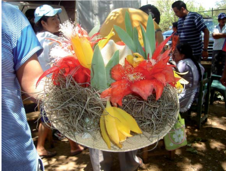
Fig. 4. Tocado para sombrero de palma elaborado con especímenes de Disocactus ackermanni , Prosthechea karwinskii y Tillandia usneoides .