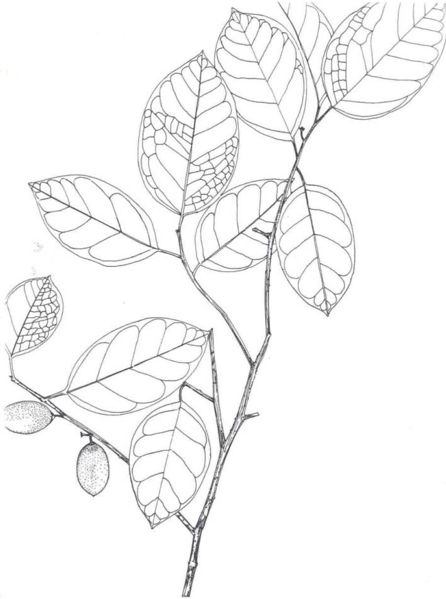
Fig. 2. Dibujo de una rama de Ottoschulzia pallida Lundell mostrando frutos y hojas (por Rita Alfaro Bates).