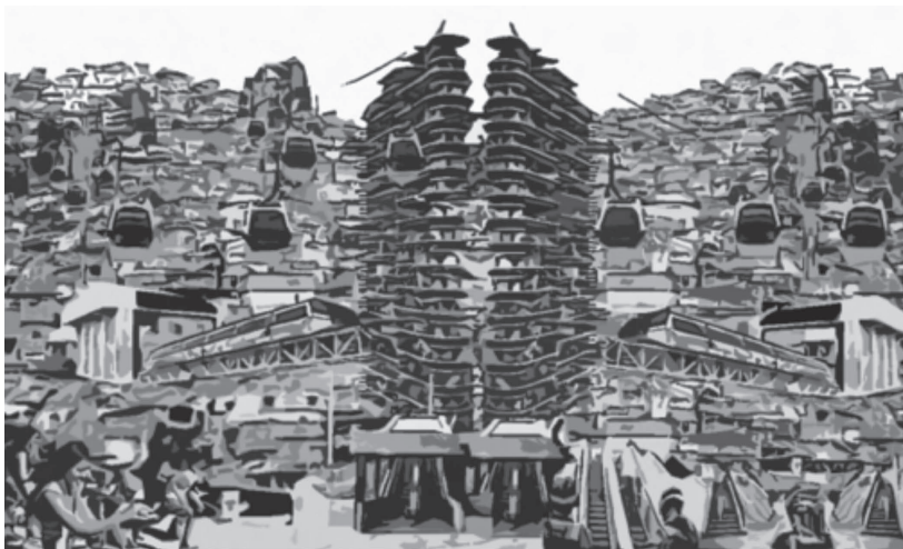
Imagen 4. Modelo de periferia vertical.

La integración de los espacios públicos verticales, con las edificaciones institucionales, transporte público, mobiliario urbano que mejore el paisaje; todos estos elementos deben funcionar como red consolidada en