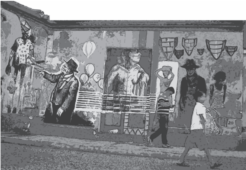
Imagen 1. Patrimonio simbólico de los barrios.

Por otra parte, los debates que han emergido como nueva realidad en los dos últimos siglos con la intensificación y aceleración son las periferias vulnerables latinoamericana, que se han convertido en los fantasmas que atemorizan a las grandes ciudades.