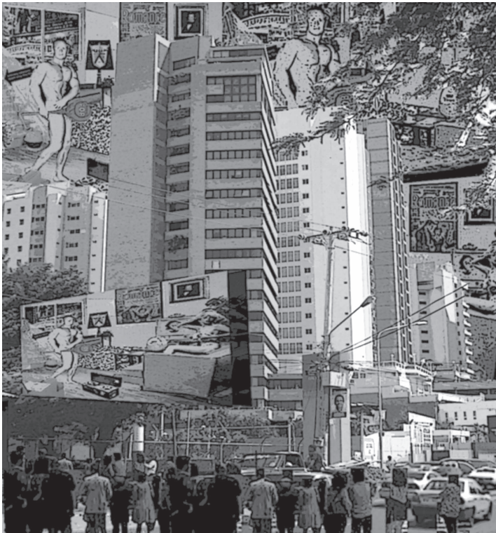
Imagen 2. Modelo de ciudad globalizada y capitalista.

Dentro de este marco comenzó la “ciudad colonial”; por muchos años se ha creído que sus orígenes se remontan a la conquista hispana, pero para ese momento ya existían las civilizaciones precolombinas (aztecas, mayas, incas), las cuales dejaron un amplio legado en la historia, por contar con extensos conocimientos en la