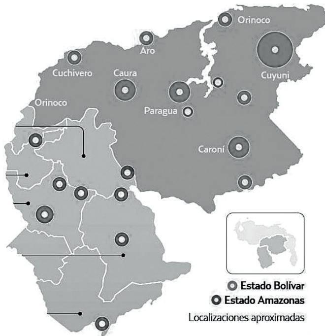
Gráfico 3. Cuencas afectadas por la minería ilegal en el estado Bolívar. Elaborado a partir de http://www.el-nacional.com/sociedad/control-logrado-extraccion-ilegal-Guayana_0_644935743.html