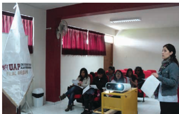
Figura 2. Capacitación a estudiantes del semillero UDED Arequipa

En la etapa 2 se realizó la capacitación a las 15 estudiantes de la EAP de Psicología Humana que conformaban el semillero de las tres UDED (Unidad Descentralizada de Educación a Distancia). Se desarrollaron sesiones para capacitarlas en el manejo de los instrumentos y brindarles pautas para evaluar a los estudiantes. Estas sesiones se ejecutaron de manera sincrónica, una vez por semana, durante dos meses, mediante la plataforma de Blackboard a través de la sala de conferencia Illuminate; tres días de manera presencial, en cada una de las provincias seleccionadas, para que realicen la administración de los 7 instrumentos seleccionados para evaluar y diagnosticar el bullying y los factores psicológicos en los participantes.