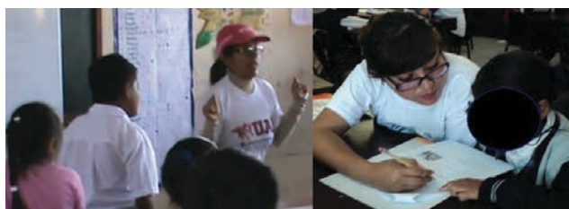
Figura 3. Estudiante Semillero DUED-Lima y UDED Arequipa realizando evaluación.

En la etapa 3 se administraron los instrumentos de recolección de datos en los distritos de San Juan de Lurigancho (Lima), Cerro Colorado (Arequipa) y El Porvenir (Trujillo), a razón de una semana por distrito. Previamente se realizaron las coordinaciones con los directores de las instituciones educativas seleccionadas, quienes aceptaron participar en el proyecto. A ellos se les envió una carta de presentación y el consentimiento informado para que sea firmado por los padres de familia de los menores del 4to y 5to grado de primaria. Obtenida la autorización y el consentimiento firmado, se concurrió a las instituciones educativas para evaluar a los estudiantes en el lapso de una semana en cada distrito seleccionado.