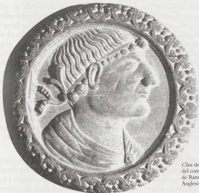
Clau de volta de la sala capitular del convent de Bellpuig, retrat de Ramon de Cardona Anglesola, d'autor desconegut