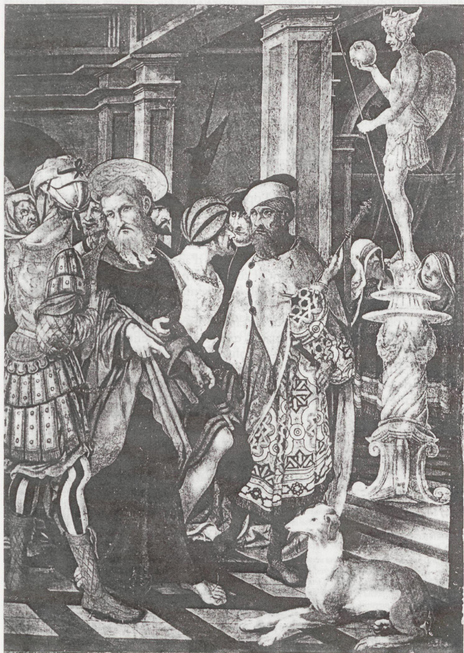
Joan de Borgonya, escena de la vida de Sant Bartomeu. Col·lecció particular