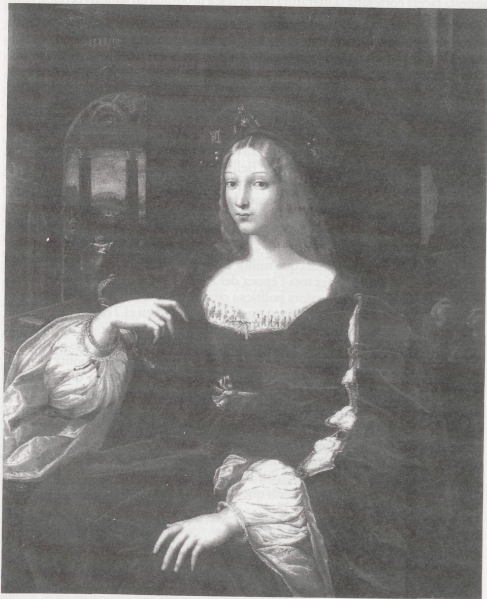
Giulio Romano i Rafael d'Urbino, retrat d'Isabel Enriquez de Requesens. Museu del Louvre