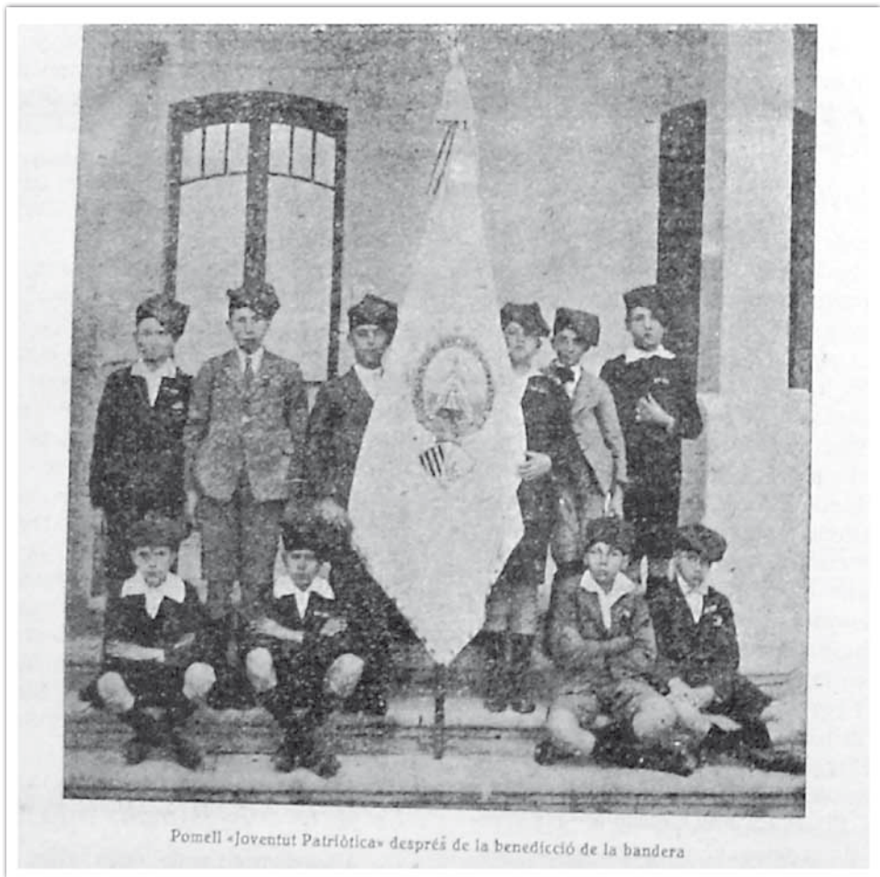
Membres del pomell "Joventut Patriòtica" de Mollerussa amb la seva bandera després de ser beneïda. Revista Urgell-Segarra núm. del 4 de juny del 1922.

se'n té constància a Mollerussa, eren, segons la Fundació Folch i Torres, 5 per bé que hi ha constància que eren set. 9