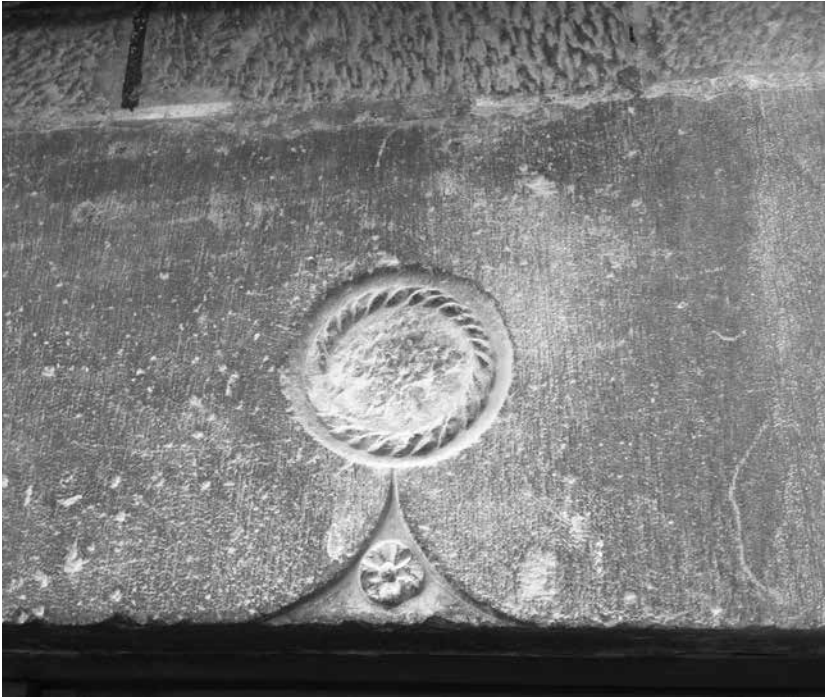
Detall decoratiu d'una llinda de la casa Ripoll d'Anglesola (1500-1600)

morirà el 1555. Se li va fer novena i cap d'any amb assistència de tota la comunitat de preveres i frares del convent de trinitaris d'Anglesola. 17