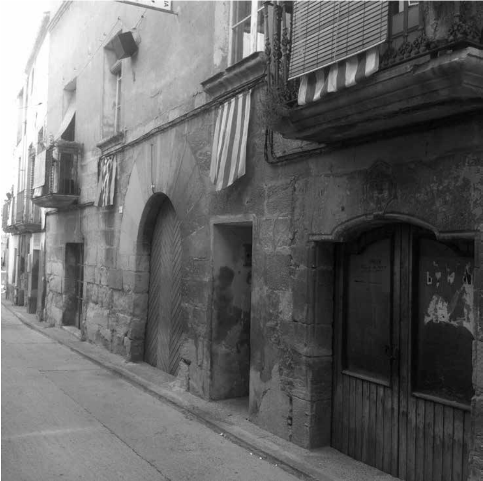
Casa Ripoll d'Anglesola (1550-1600)