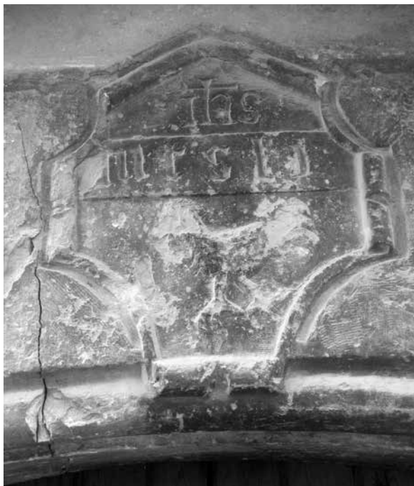
Detall del símbol heràldic dels Ripoll (gall) en una de les llindes de la casa Ripoll d'Anglesola (1600 - 1650 aprox.)