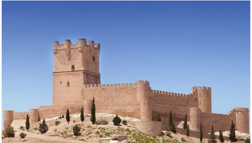
Castillo de la Atalaya (Villena).

finales no han pasado de la edición de material promocional e informativo. La creación, la ejecución, la implantación y la gestión de esta ruta constituye una estrategia de acción pendiente y que, sin embargo, ofrece enormes posibilidades de éxito, siempre que se conciba, se desarrolle y se gestione como un verdadero producto turístico (Rico y Navalón, 2011).