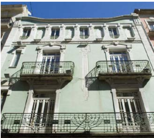
Genihilibus aut que venesci psandunt. Vit earum excerate omnis eosam experfe rspicim olorpporunt.

El contenido patrimonial del conjunto histórico de Altea, de origen islámico, nace fundamentalmente de la transformación urbana que sufre esta población en época moderna con la construcción del recinto fortificado para defensa de los ataques berberiscos. Transformaciones urbanas