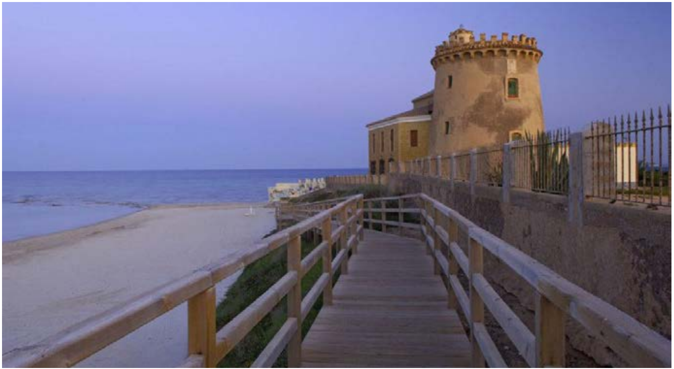
Genihilibus aut que venesci psandunt. Vit earum excerate omnis eosam experfe rspicim olorpporunt.

la muestra del grado de atractivo turístico que tienen estos elementos patrimoniales intangibles en la localidad donde tienen lugar. Como se muestra en la tabla 4 (ver en el anexo), los elementos intangibles declarados BIC por la normativa autonómica como rituales festivos son Les Fogueres de Sant Joan (Alacant), el Betlem de Tirisiti y Cavalcada dels Reis Mags (Alcoi), el Misteri (Elx), y el Ritual del Pa Beneit (Torre de les Maçanes). El caso del Centre de Cultura Tradicional de Pusol se incluye en la categoría de oficios y saberes tradicionales. Algunos de ellos al mismo tiempo, tienen su correspondiente declaración como Fiesta de Interés Turístico Internacional. El resto de elementos de la tabla corresponden a las FITN y las FITI, fundamentalmente centradas en celebraciones históricas (Moros y Cristianos, Hispano-Árabes), religiosas (Semana Santa, Procesión del Domingo de Ramos, La Pasión) y tradición musical (Certamen Internacional de Habaneras y Polifonía).