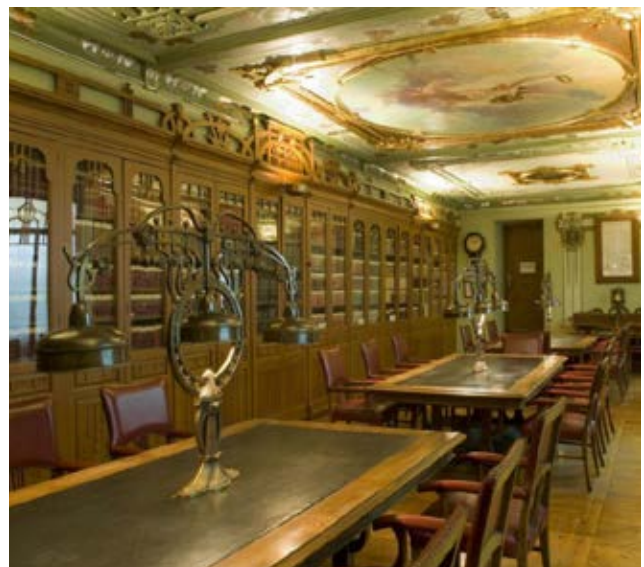
Genihilibus aut que venesci psandunt. Vit earum excerate omnis eosam experfe rspicim olorpporunt.