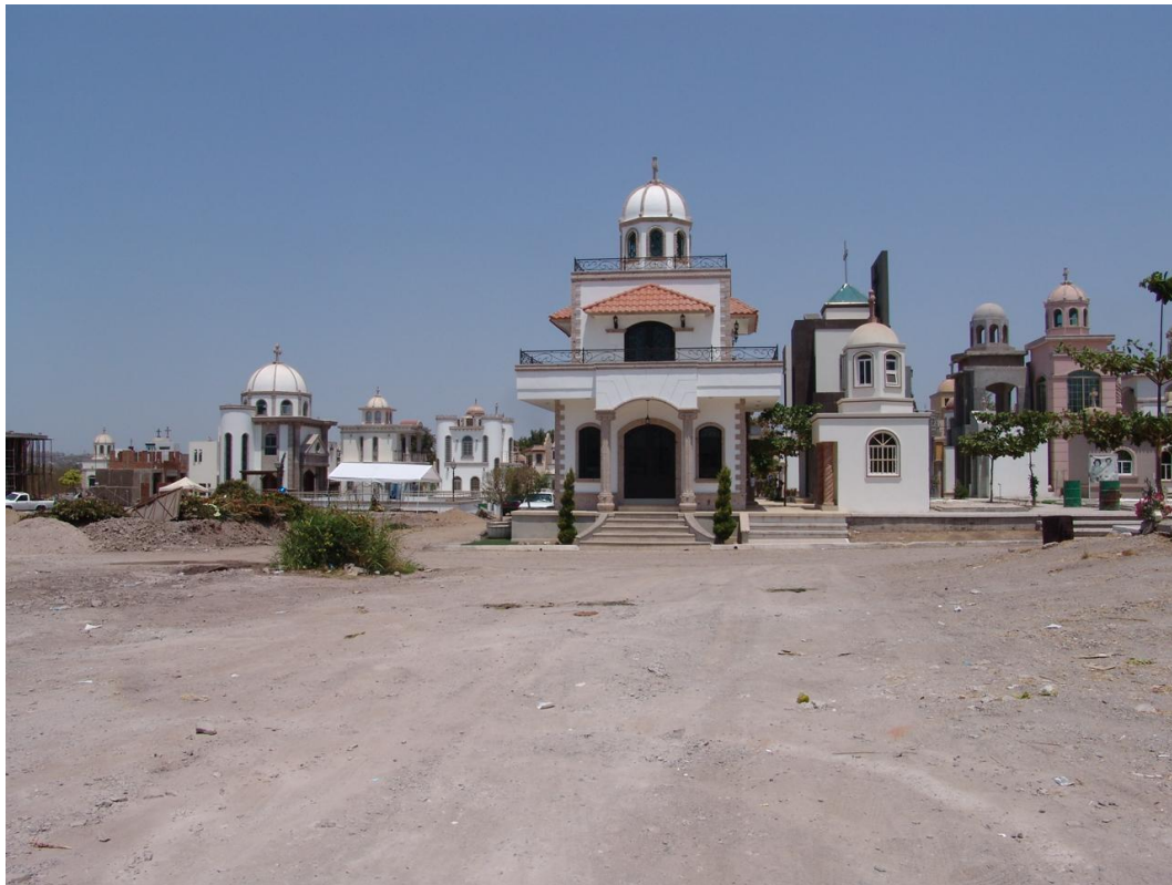
Figura 7. Jardines del Humaya

Componente material del ritual funerario, la tumba contribuye al afán humano de “ retener lo efímero y lo fugitivo ”, o construir para permanecer (Hans-Georg Gadamer, 2002, pp. 112 y 113). La muerte es dotada de sentido en el intercambio simbólico, cuando es dada y recibida, de ahí que se torne asunto de grupo cuando es violenta, lo más cercano al sacrificio primitivo. La disyunción vida-muerte genera en la realidad de los vivos el imaginario de la muerte, una oposición de extremos excluyentes que es posible disolver sólo en términos simbólicos (Jean Baudrillard, 1993). Esta arquitectura es soporte simbólico o representación de una determinada representación del ritual funerario cuyo significado compartido produce formas reconocibles porque es justo lo que se pretende con ellas: sólo representar, por ello debe quedar claro cuál es la forma convenida para hacer legible tal fin.