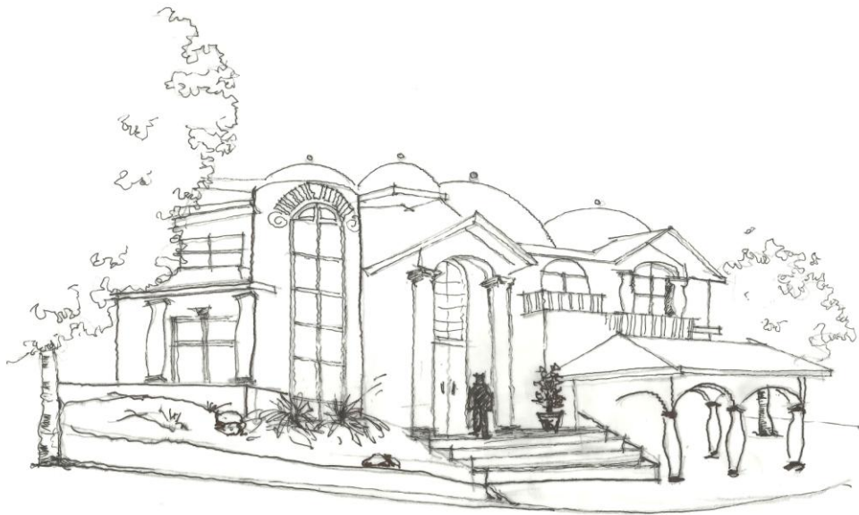
Figura 2. Apunte de residencia