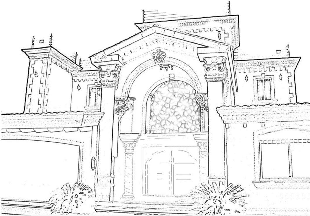
Figura 1. Apunte de residencia