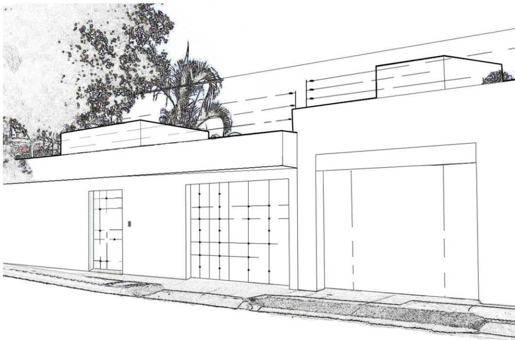
Figura 3. Apunte de residencia

El tercer momento es el lustro más reciente, distintivo por el combate frontal al narcotráfico 5 . Los factores que confluyen en éste son los mismos del momento anterior, cuya cristalización se ha profundizado, sólo se ha agregado una situación de emergencia debido a la confrontación inter-cárteles y la persecución de policías y fuerzas armadas. Ante el acoso, las casonas –muchas en proceso de construcción– han sido abandonadas de súbito y ofrecen un paisaje desolado en tanto el narco se ha replegado, ocultado y disimulado. El abandono del exhibicionismo como disposición en escena del éxito individual, con la búsqueda simultánea del reconocimiento social de una posición distinguida sin menoscabo de recursos, tiene como relevo congruente el debilitamiento de las manifestaciones expresivas al grado de convertirse en componente inocuo del sitio. Pero la irrelevancia visual no impide que éste sea un foco de tensión y por lo mismo interfiera cualquier recreación que haga lugar. Los dispositivos del estilo de vida de lujo y placer instrumentados en artificios domésticos se han introvertido, desplazados al interior discreto, a la vez que se han enfatizado los subterfugios de seguridad para hacer invisible la presencia, vigilancia y escape de residentes (ver figuras 3 y 4).