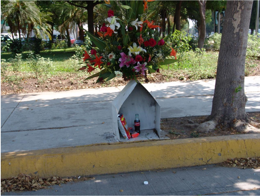
Figura 5. Nicho en una banqueta de Culiacán