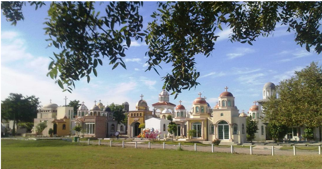
Figura 6. Jardines del Humaya