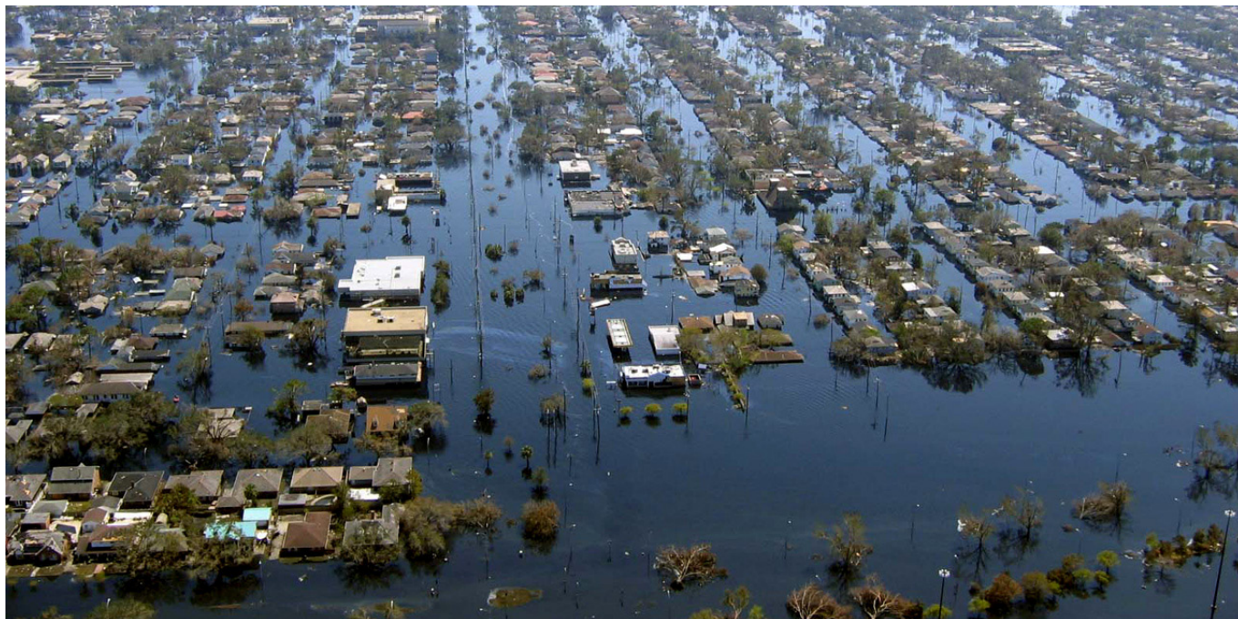
Foto: Nueva Orleans inundado tras el paso del huracán Katrina en 2005.

que tienen una persona o comunidad acerca de un posible riesgo debe ser un insumo fundamental para quienes desarrollan acciones de comunicación de riesgos. Recordemos que la gente responde únicamente ante los riesgos que percibe.