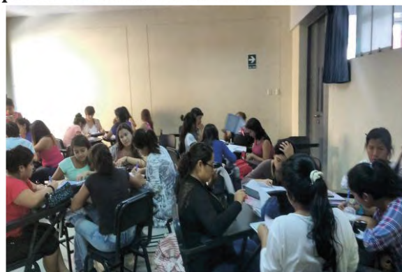
Figura N° 01. Estudiantes desarrollando habilidades sociales.

Habilidades sociales : es el talento en el manejo de las relaciones con los demás, en saber persuadir e influenciar a los demás.