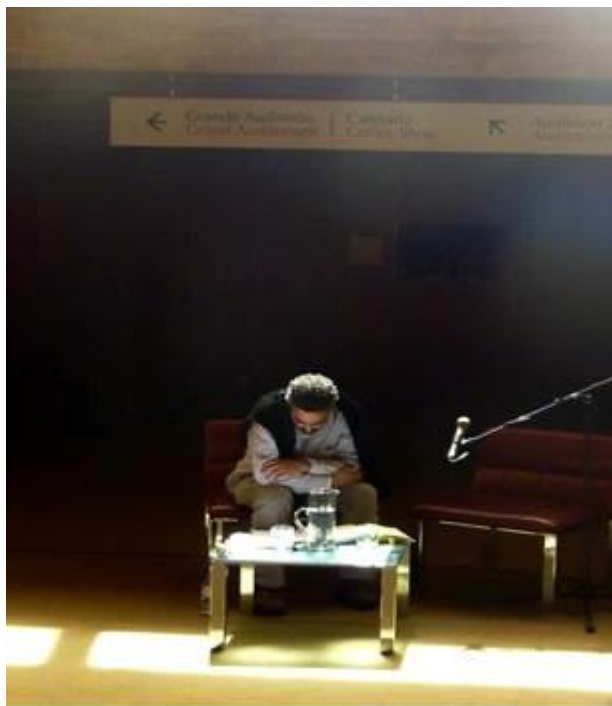
Fig. 2 Na sala de leitura

nesta postura de recolhimento que o professor pode desvendar os mistérios das relações de Pessoa com a memória literária.