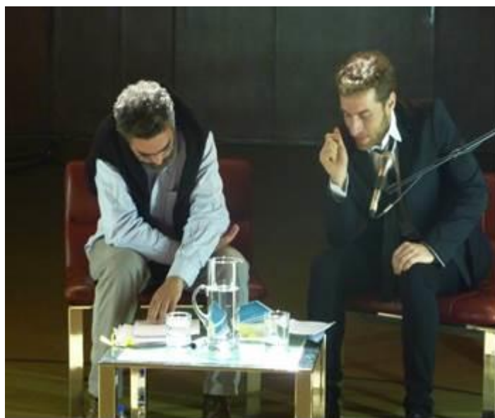
Fig. 3 Leitura de Fernando Pessoa

A viagem-leitura proposta ao leitor-espetador não anula as interpretações já realizadas, mas procura antes redimensioná-las e criar novos nexos intertextuais, explorando o diálogo interartes entre o desenho, a literatura, o teatro e a arquitetura. É desde uma posição recuada que o escritor-professor interpreta os textos de Pessoa em “pessoa”: olhando, analisando e desviando-se dos caminhos já trilhados.