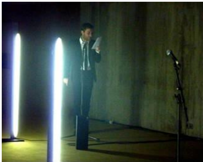
Fig. 1 Performance na cidade