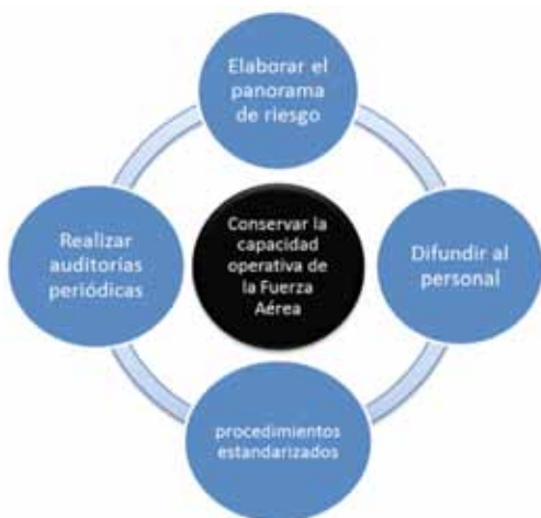
Figura. 1 Objetivos del Programa GAP. Elaborado por TE. Roa, P. y TE. Monsalve, J., (2011).