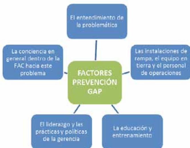
Figura 2. Factores Contribuyentes GAP. Elaborado por TE. Roa, P. y TE. Monsalve, J.(2011).

Los factores que contribuyen a que se presente una novedad operacional en tierra son: el entendimiento de la problemática; las instalaciones de rampa, el equipo en tierra, el personal de operaciones; la educación, el entrenamiento; el liderazgo, las prácticas y políticas de la gerencia; la conciencia en general dentro de la FAC hacia el problema (Ver Figura 2).