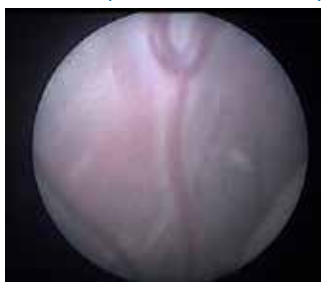
FIGURE 6. ARTERIO-VENOUS ANASTOMOSIS FROM THE SMALL TWIN TO THE BIG ONE (VIDEO AVAILABLE ONLINE)

Monochorionic pregnancies, which constitute 20% of twin gestations, have a risk of miscarriage before 24 weeks of 12% that is 6 times higher than the risk of dichorionic pregnancies (1) .