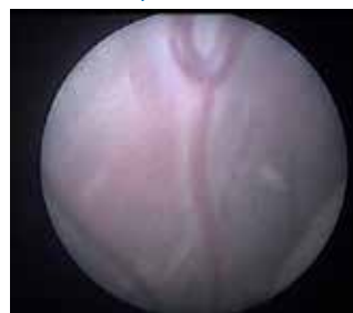
FIGURA 6. ANASTOMOSIS ARTERIO-VENOSA DEL GEMELO PEQUEÑO AL GEMELO SANO (VIDEO DISPONIBLE ONLINE).

Como mencionamos anteriormente, la circulación placentaria compartida por ambos gemelos genera complicaciones, entre las cuales la RCIU selectiva se presenta en 12% de las gestaciones monocoriales (2) .