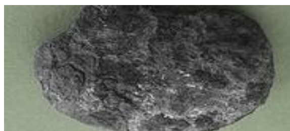
Torta de Plata