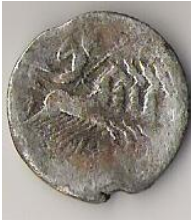
2 Denario forrado(alma de cobre y capa superficial de plata)

En este periodo, paralelamente al denario republicano nos encontramos con grandes piezas del Dios Jano Bifronte, moneda con la que mayoritariamente se pagaba el comercio en todo el estado republicano y que en nuestra zona estuvo bastante presente.