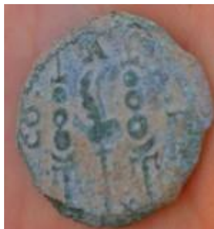
Semis AE Leg. Emerita AUG