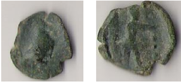
Md. con Vulcano