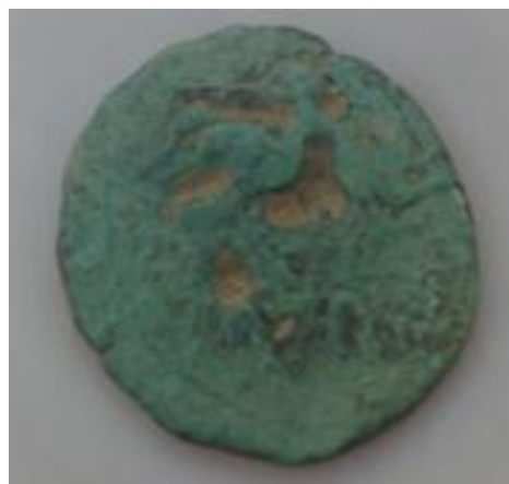
Monedas Locales Mineras.