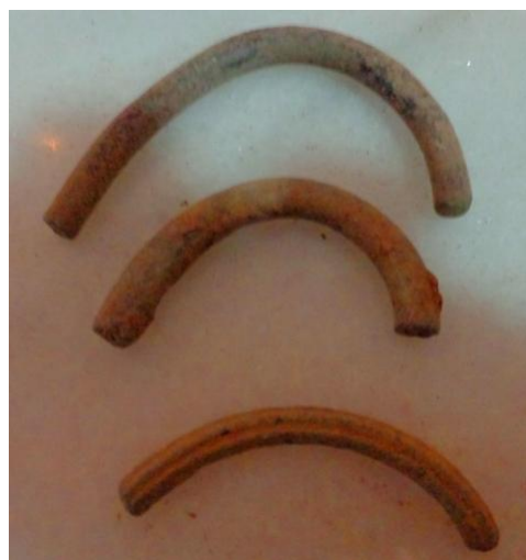
Diferentes premonedas del Término Vca según Celtic Ring Money

Leyendo y haciendo mis propios análisis, es muchísima la coincidencia de los mismos objetos en tantos lugares a la vez, pero quiero contribuir con el pensamiento del más escéptico, que sería mucha la casualidad de las formas, medidas y pesos, los cuales no entraré a detallar por tratarse de un tema un poco más complejo.