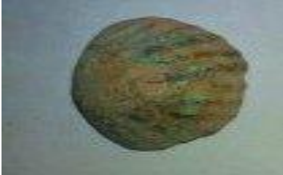
Concha de bronce

Otros elementos destacables de esa misma etapa podrían ser las formas detalladas en concha, pequeñas ruedas de cobre u objetos en forma cereal.