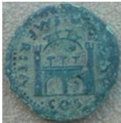
As AE Col. Emerita AUG

Concluyo con las imágenes de dos bellas monedas autóctonas extremeñas que tantos y tantos años de esplendor dieron a la sombra de aquellos bolsillos y escudillas.