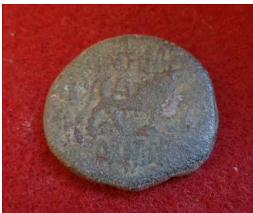
As Resello Campamentos leg de Gracurris