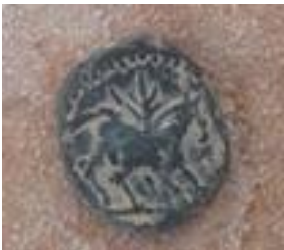
Incierta con Influencia Indígena

No quiero pasar por alto en esta etapa, la gran afluencia de mineros de todo el territorio hispano en la zona, un punto a detallar porque también en ese periodo funcionaron con moneda local, piezas creada o reutilizadas por y