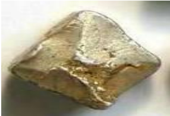
Plata recortada, 3,7 gr.

tenerlos cortados en denominaciones aproximadas con antelación habrían facilitado las transacciones más sencillas.