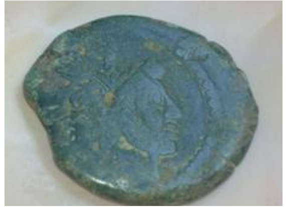
Gran AE con Anv. Dios

En este periodo, paralelamente al denario republicano nos encontramos con grandes piezas del Dios Jano Bifronte, moneda con la que mayoritariamente se pagaba el comercio en todo el estado republicano y que en nuestra zona estuvo bastante presente.