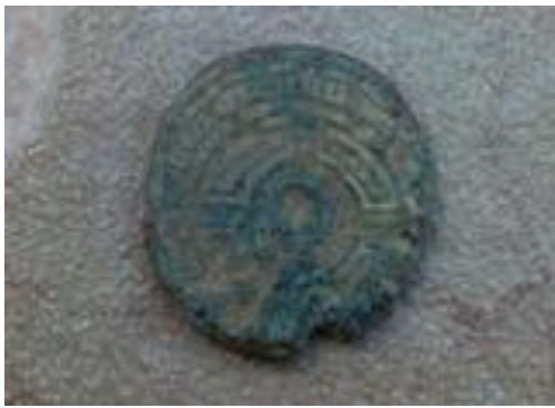
As AE con Rodela