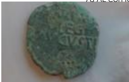
As AE Publio Carisius