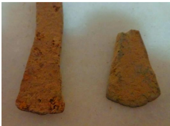
Diferentes premonedas de la zona según el Celtic Ring Money.Vca

Si realmente estamos siguiendo la línea de estudios inglesa y alemana donde originariamente ha nacido toda esta base con la denominación "CELTIC RING MONEY", en la que se está incluyendo todo este tipo de objetos, si esta hipótesis es constatable, es interesante anotar que nuestro término municipal y su entorno se encontraba a la altura monetaria de cualquier parte de Europa, sobre todo del mundo anglosajón.