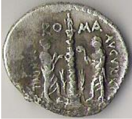
1 Auténtico denario

provechos de plata para su posterior comercio.