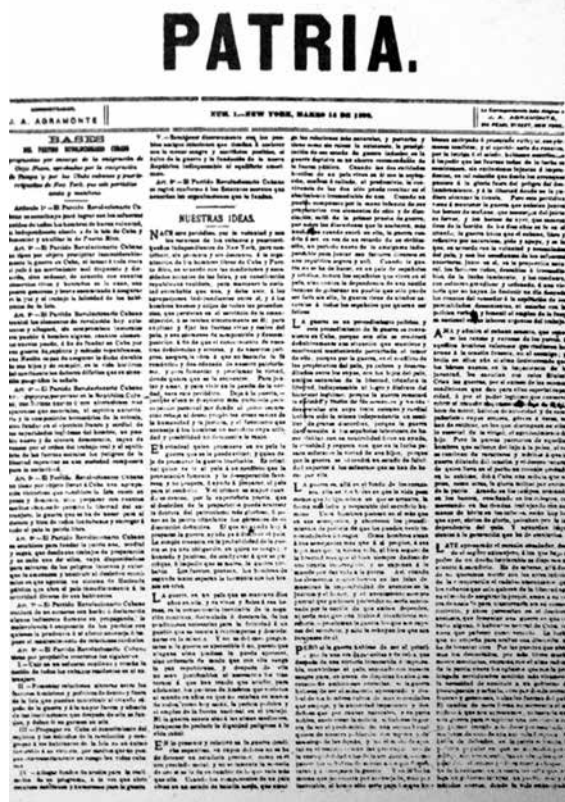
Figura 5. Periódico Patria .

Pese a algunas dificultades como la censura y la libertad de imprenta, el dinamismo de la economía de exportación cubana facilitó la constante circulación de personas y publicaciones a través de las cuales los distintos estratos sociales insulares estuvieron informados sobre los principales hechos que ocurrían en el mundo y las corrientes políticas e ideológicas en boga en Europa y América. Por eso el siglo XIX fue un momento decisivo de máxima importancia histórica para el desarrollo de la cultura cubana.