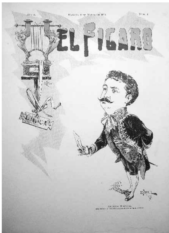
Figura 3. El Figaro .

de Semanario de Sports y de Literatura. Órgano de Base-ball , el primer número de El Figaro ; entonces una revista fundamentalmente deportiva. Fue cambiando su nombre y a partir de 1901 se publicó bajo el nombre de El Figaro. Revista Universal Ilustrada , con frecuencia mensual. El fundador principal, también director en 1886, fue Rafael Bárzaga, junto a Manuel Serafín Pichardo. En esta publicación podemos encontrar poesías, prosas poéticas, crónicas sociales, notas sobre actividades culturales, encuestas sobre problemas candentes de la actualidad nacional. Allí se encuentran trabajos de las principales figuras del movimiento literario cubano y latinoamericano como Juana Borrero, Julián del Casal, Rubén Darío y Miguel Gutiérrez Nájera. Contó con otras firmas de renombre como las de Manuel Sanguily, Enrique José Varona, Rafael Montoro, Justo de Lara, Nicolás Heredia y Carlos Pío y Federico Uhrbach. La revista publicó un Número-Álbum que se nombra también Álbum de El Figaro , que rindió homenaje a los precursores de la independencia de Cuba, al resumir hechos trascendentales ocurridos en la guerra, parte integrante de la historia de la revolución en Cuba, iniciada en el año 1868 al destacar el papel tan importante que realizó la prensa en la manigua y en el extranjero.