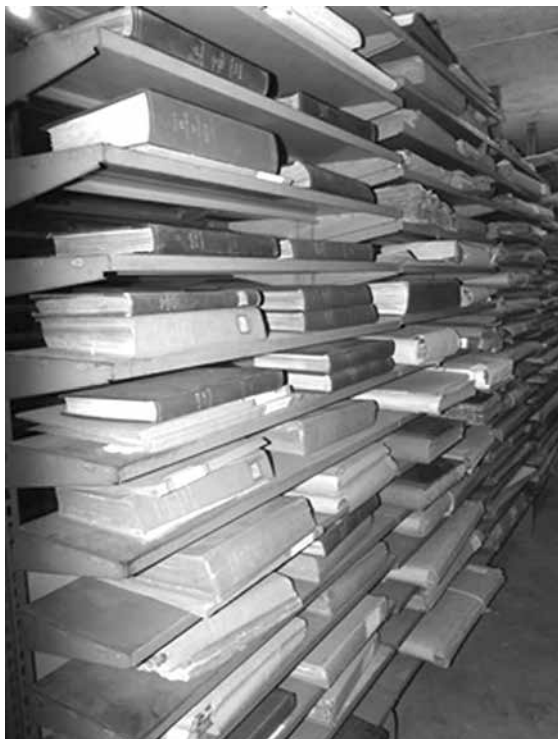
Figura 1. Fondo de publicaciones de la Sala Cubana.

Las más solicitadas entre las revistas son: El Figaro , Cuba y América , La Habana Elegante , Cuba Literaria , Revista de Cuba , Revista Cubana , Brisas de Cuba , La Cartera Cubana , El Colibrí , El Mensajero Semanal y el Curioso Americano entre otras. Se consideran en algunos casos revistas finiseculares