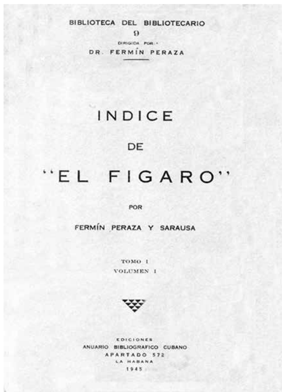
Figura 4. Portada del Índice de El Figaro .