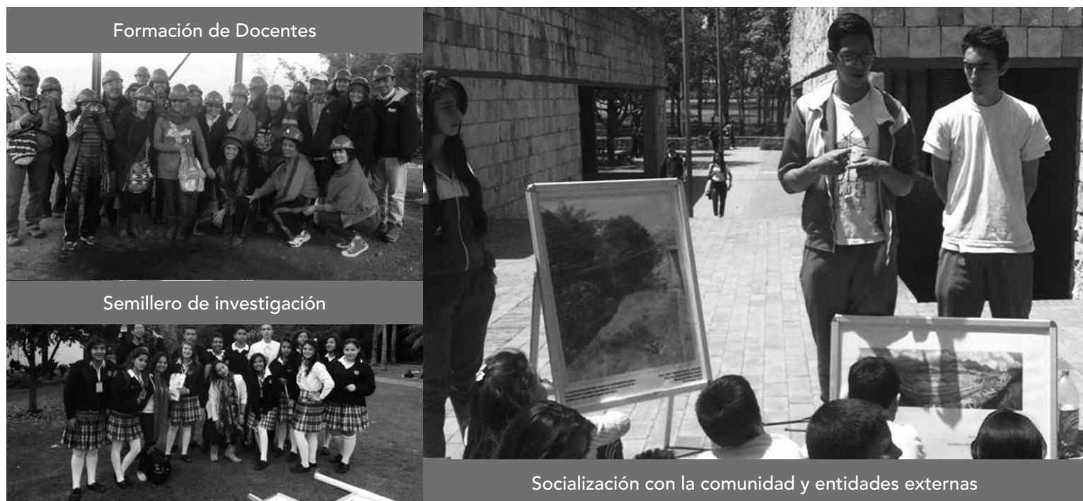
Cuadro 1. Sujetos que participan de la experiencia pedagógica

El proceso se desarrolló en varios momentos y espacios que implicaron transformaciones de los distintos sujetos participantes alrededor de su relación con el territorio (Ciudad Bolívar) y con las problemáticas que lo constituyen, pasando, de un lugar que se imagina, a entenderlo como “propio”.