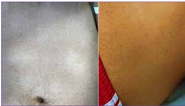
Figura 3. Lesiones petequiales distribuidas sobre la región toracoabdominal.

El paciente es trasladado a una Sala General donde recibe el mismo manejo que en la UCI, inclusive terapia de anticoagulación y líquidos por vía endovenosa. Tras dos días más de hospitalización, es dado de alta en adecuadas condiciones generales, con recuperación satisfactoria del estado neurológico basal. Como secuelas, el paciente refiere escotomas bilaterales ocasionales en la consulta de control a los tres meses del episodio traumático.