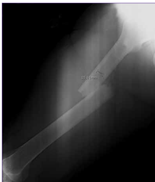
▲ Figura 1. Fractura del tercio medio de la diáfisis del fémur derecho.

Se solicita tomografía computarizada con protocolo para tromboembolismo pulmonar y se documenta leve zona de oligohemia en fase pulmonar sin otros hallazgos relevantes. Al segundo día en la UCI, se evidencia normoxemia con un estado neurológico estacionario sin agitación. Ese día, se inicia la alimentación por vía oral asistida, con adecuada tolerancia. Al quinto día de evolución en la UCI, el paciente está alerta, orientado, sin dificultad respiratoria, con estabilidad hemodinámica sin requerimiento de vasopresores; se retira de forma definitiva la ventilación no invasiva después del destete progresivo. Se le da el alta de la UCI.