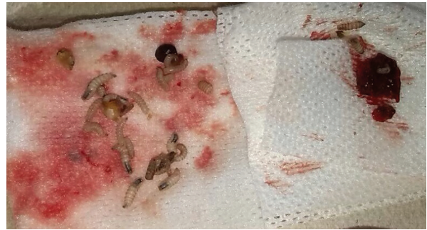
Figura 3. Larvas de díptero extraídas de cavidad oral

iguales medidas de limpieza y se extraen dos larvas adultas, una pequeña y demás residuos de dientes temporales. Durante la tercera visita realizada a los ocho días, se comprueba la ausencia de larvas y se observa adecuada evolución de cicatrización e higiene oral. No se realizó identificación del agente etiológico, dada la limitación geográfica para el estudio y que este no es finalmente el objetivo de la presentación del caso.