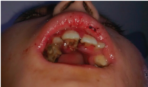
Figura 1. Abscesos de larvas en región anterior de la cavidad oral

rechazo a la vía oral asociado a hemorragia gingival en incisivos superiores. Al ingreso se encuentra paciente con parálisis motora generalizada, hidratado, tolerando dieta líquida, al examen bucal se destaca estado de salud oral deficiente, hiperplasia gingival medicamentosa y piezas dentales temporales en mal estado. Adicionalmente, se observan 11 abscesos de larvas distribuidos de la siguiente manera: dos en región vestibular de incisivos superiores, tres en región vestibular de incisivos inferiores, tres en región palatina de incisivos superiores y tres en región lingual de incisivos inferiores (Ver Figuras 1 y 2).