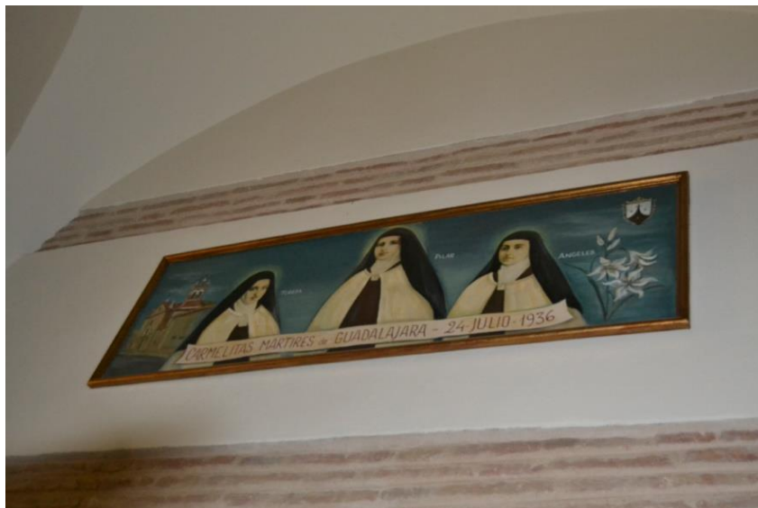
Santas mártires de Guadalajara, estampa en la nave del evangelio del convento de carmelitas descalzas de Ronda.