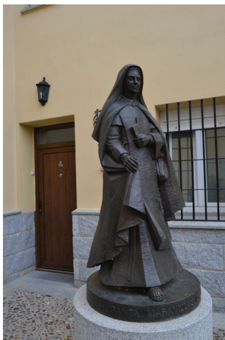
Imagen de Santa Maravillas de Jesús en la entrada del Carmelo de San Lorenzo de El Escorial.

A las entradas de estos Carmelos suele haber una imagen de Santa Maravillas con la iconografía que en base a ella se está realizando, con su libro y su bolsa de dinero para los pobres.