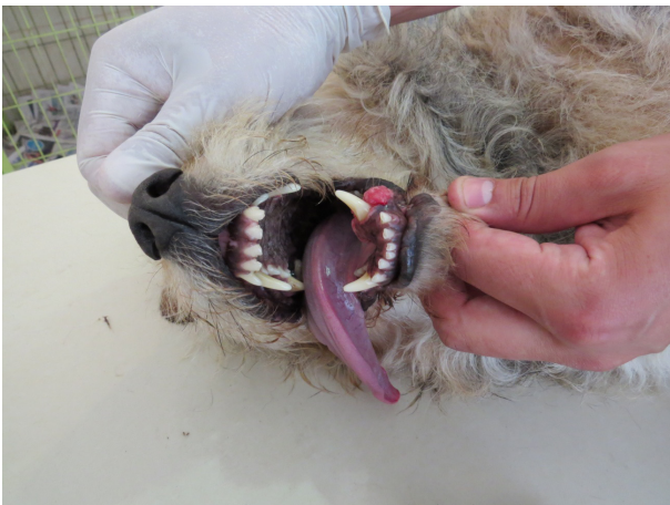
Figura 1. Foto de masa gingival en el colmillo mandibular izquierdo de delimitada y de características irregulares, que levanta el colmillo y deforma la mandíbula levemente.

Paciente presenta un carácter agresivo, su condición corporal de 4 (1-7), su temperatura es de 38,7 °C, posee mucosas oculares y gingivales rosadas, tiempo de llene capilar de 1 segundo, su frecuencia cardiaca es de 110 latidos por minuto y su frecuencia respiratoria no se pudo evaluar, debido a que presenta jadeo; no se aprecia dolor a la palpación abdominal. Solamente se evidencia una masa gingival en el colmillo mandibular izquierdo de características irregulares y delimitada, la cual levanta el colmillo y deforma la mandíbula levemente (Figura 1).