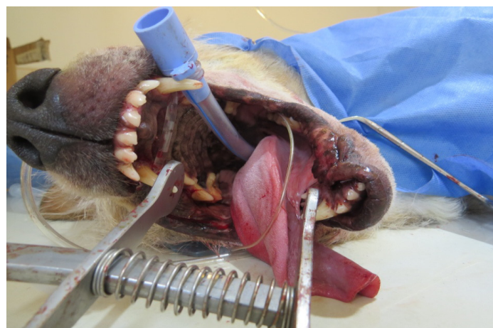
Figura 3. Procedimiento quirúrgico terminado, se aprecia las suturas de las mucosas labiales izquierdas y la mucosa mandibular.

Utilizando un elevador perióstico, se profundizó y separó la mucosa gingival para exponer la parte lateral y ventral de la rama mandibular. Luego, con un osteótomo y un martillo se cortó el extremo rostral de la rama y se separó la sínfisis. La hemostasia se realizó mediante la compresión con gases o puntos transfixiantes. El defecto se corrigió mediante elevación de un colgajo de mucosa procedente de la zona próxima de los labios. Se elevó la mucosa y submucosa para permitir la aproximación de la mucosa gingival. La sutura se realizó en capas, primero puntos simples en la submucosa, luego una segunda capa de puntos simples de aproximación para unir de modo adecuado las mucosas labial y gingival con la mucosa sublingual (Figura 3) 7 .