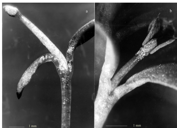
Figura 3. Vista con microscopio estereoscópico de epicótilo y perfilo glabros en (a) Lotus tenuis (120 X) y pubescentes en (b) Lotus corniculatus (130 X).

confirmar que la pubescencia de las plántulas de entre 12 y 35 días es una característica confiable para diferenciar las dos especies, en contraposición a lo reportado por Lagler (2003). Las observaciones de pubescencia pueden efectuarse bajo lupa binocular, equipo común en los laboratorios de semillas y no requiere procesamiento complejo ni entrenamiento especial para su determinación. Si bien el estudio presenta la desventaja de que se debe esperar el desarrollo adecuado de las plántulas, este carácter es el más apropiado, desde el punto de vista práctico.