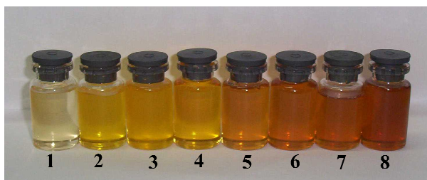
Figura 2. Muestras de miel de diferentes grados de color provenientes de distintas regiones de la Pcia. de Buenos Aires. Colores: blanco agua, 1; blanco, 2 – 4; ámbar extra claro, 5; ámbar claro, 6 y 7; ámbar, 8. Procedencia de las mieles: 1: Pcia. Pampeana, Dist. Oriental; 2 – 4: Pcia. Pampeana, Dist. Austral; 5 – 8: Pcia Paranaense.