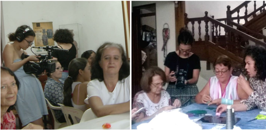
Figura 7. Investigadora registrando el desarrollo de distintas actividades