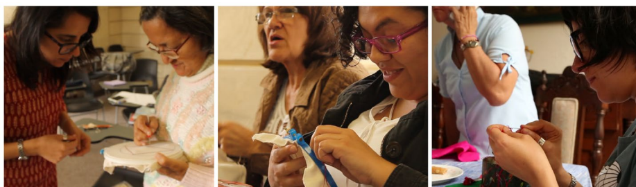
Figura 3. Investigadoras aprendiendo a bordar en compañía de maestras bordadoras