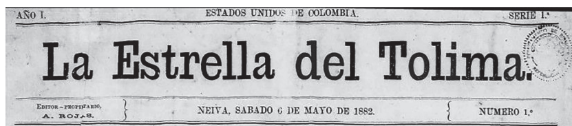
Imagen 1. Cabezote de La Estrella del Tolima hasta el número 91.

El diseño de La Estrella fue constante durante su existencia en tamaño, diseño y extensión. Un cambio notorio ocurrió en su cabezote, escueto hasta el número 91: