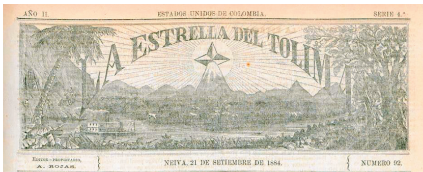
Imagen 2. Cabezote de La Estrella del Tolima desde el número 92.

Y expresivo y bellamente evocador desde el número 92: