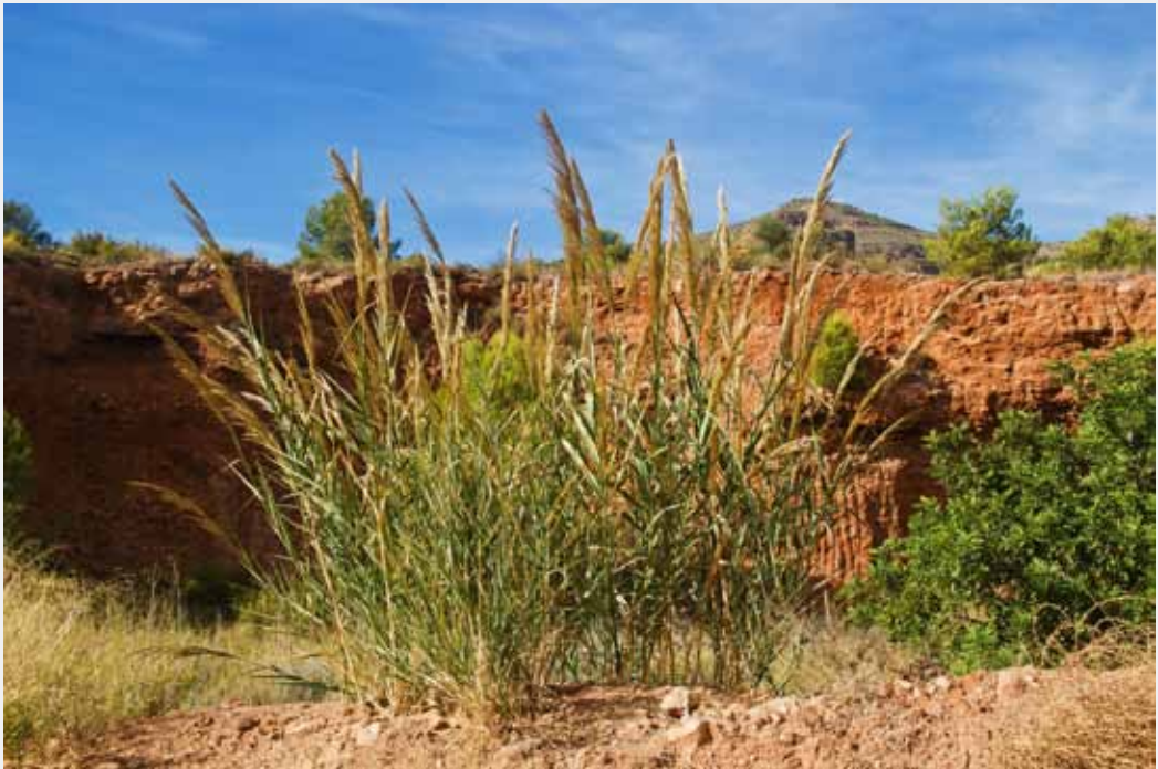
FIGURA 2. Arundo micrantha al barranc de Garrut (la Vall d'Uixó, Castelló).

Rebut el 30 d'abril de 2016. Acceptat el 18 de maig de 2016.