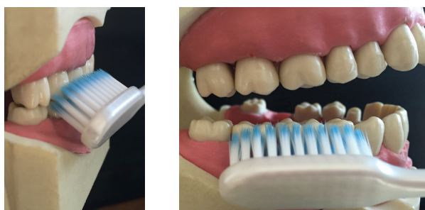
Figuras 6a, 6b. Técnica vibratoria de Charters.

La técnica vibratoria de Charters es la menos recomendada (27), fue descrita por Charters en 1928 y está indicada en pacientes adultos con enfermedades periodontales; el objetivo de esta técnica es la eliminación de la placa interproximal (Figuras 6a y 6b). Para realizarla, se debe ubicar el cepillo formando un ángulo de 45 grados con respecto al eje dental pero dirigido hacia el borde incisal, y se presiona ligeramente para que los filamentos penetren en el espacio interdental. Se realizan movimientos vibratorios que producen un masaje en las encías (30).