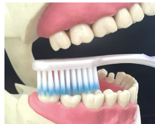
Figura 4. Técnica horizontal de Scrub.

La tercera técnica es la técnica horizontal de Scrub (27), ésta consiste en que los filamentos del cepillo se colocan en un ángulo de 90 grados sobre la superficie vestibular, linguo-palatina y oclusal de los dientes (Figura 4). Se realiza una serie de movimientos repetidos de atrás para adelante sobre toda la arcada, la cavidad oral se divide en sextantes y se realizan 20 movimientos por cada sextante (30); se ha demostrado que es el método de elección en niños en edad preescolar, porque ellos tienen menor habilidad para llevar a cabo otros métodos de cepillado y se encuentran en la edad en la que están desarrollando sus capacidades motoras (28), pero a la vez, se ha observado que las técnicas de cepillado horizontal aumentan la abrasión del esmalte (33).