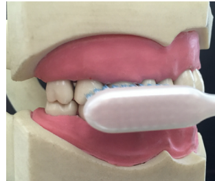
Figura 3. Técnica de Fones.

La segunda técnica más recomendada es la técnica de Fones (27), que está indicada para las superficies vestibulares; para llevarla a cabo, los dientes deben estar en oclusión o en posición de reposo, y los filamentos del cepillo se colocan formando un ángulo de 90 grados con respecto a la superficie bucal del diente (Figura 3). Estas superficies se dividen en 6 sectores y se realizan 10 amplios movimientos rotatorios en cada sector. En las caras oclusales, se realizan movimientos circulares y en las caras linguo – palatinas se coloca el cepillo en posición vertical y se realizan movimientos rotatorios; está indicada en niños (30,31) por la facilidad para aprenderla, en comparación con la técnica de Bass (32).