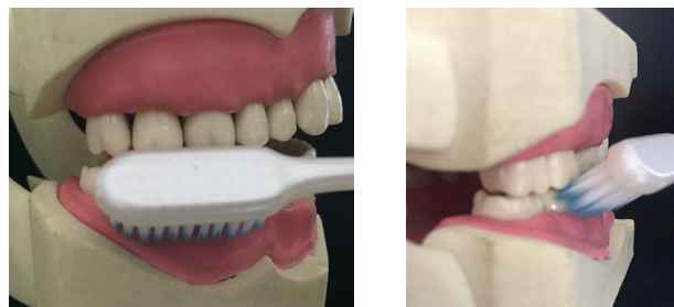
Figura 2a, 2b. Técnica de Bass.

Para la técnica de Bass se recomienda un cepillo de cerdas suaves para evitar, primero, la abrasión de la estructura dental dura, y segundo, la lesión de la encía marginal por trauma (29). La técnica consiste en que el cepillo se coloca en un ángulo de 45 grados (Figura 2a) con respecto al eje longitudinal del diente (teniendo en cuenta que las cerdas van hacia la parte apical del diente); los filamentos del cepillo se introducen en los nichos interdientales y el surco gingival, al estar ahí se realizan pequeños movimientos vibratorios y después un movimiento de barrido hacia oclusal (Figura 2b). Con esta técnica está limitada la limpieza de las superficies oclusales (30).