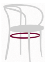
Figura 6 Estrutura circular (Elaborada pelos autores, 2008)

Abaixo do assento as pernas e os pés da cadeira aparecem visualmente como quatro elementos verticais, sendo que todos aparecem com o mesmo tamanho e são simétricos entre si. Contudo, salienta-se que as hastes que formam as pernas posteriores prosseguem para cima, indo além do assento, para compor o encosto da cadeira (Figura 2). Um pouco abaixo do assento, há outra estrutura circular de madeira que tangencia e fixa por dentro as quatro pernas da cadeira (ver Figura 6).