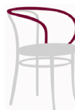
Figura 3 Braços (Elaborada pelos autores, 2008)

Os braços da cadeira, portanto, são formados por esta segunda haste de madeira, que contribui na definição do encosto e desce até a peça circular que emoldura o assento de palha (ver Figura 4).