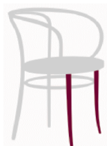
Figura 5 Pernas e pés anteriores (Elaborada pelos autores, 2008)

Abaixo do assento as pernas e os pés da cadeira aparecem visualmente como quatro elementos verticais, sendo que todos aparecem com o mesmo tamanho e são simétricos entre si. Contudo, salienta-se que as hastes que formam as pernas posteriores prosseguem para cima, indo além do assento, para compor o encosto da cadeira (Figura 2). Um pouco abaixo do assento, há outra estrutura circular de madeira que tangencia e fixa por dentro as quatro pernas da cadeira (ver Figura 6).