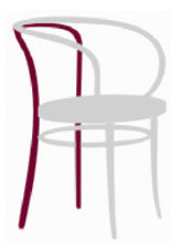
Figura 2 Pernas e pés posteriores (Elaborada pelos autores, 2008)

A imagem indica que o encosto , os braços , os pés e a estrutura que circula o assento da cadeira foram feitos com madeira sólida e vergada. O encosto apresenta uma forma que serve de apoio para a parte lombar do corpo. Os braços da cadeira são as partes do móvel que servem de apoio para os braços e antebraços do usuário. Os pés são as partes da peça que o apóiam diretamente sobre o chão. O assento da cadeira deve receber o peso do usuário que se sentará nela e, por isso, é contornado por peça circular que o emoldura e lhe oferece sustentação.