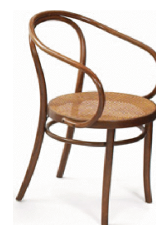
Figura 1 Cadeira Thonet - modelo 209

A Semiótica, como campo de estudos dos signos , propõe o signo como qualquer coisa que é percebida e se apresenta no lugar de outra coisa material ou imaginária, para representá-la (Peirce, 1977). As palavras e imagens aqui apresentadas representam conceitos e objetos, como a cadeira em estudo (ver Figura 1), propondo interpretantes ou ideias relacionadas a esses mesmos conceitos e objetos, na mente de leitores ou observadores. Isso compõe um conjunto de signos , os quais são propostos, ordenados e sobrepostos, por meio de processos de informação e comunicação. Esse conjunto significante visa promover, na mente do leitor ou observador, ideias referentes à cadeira, que está ausente.