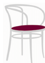
Figura 4 Assento

Os braços da cadeira, portanto, são formados por esta segunda haste de madeira, que contribui na definição do encosto e desce até a peça circular que emoldura o assento de palha (ver Figura 4).