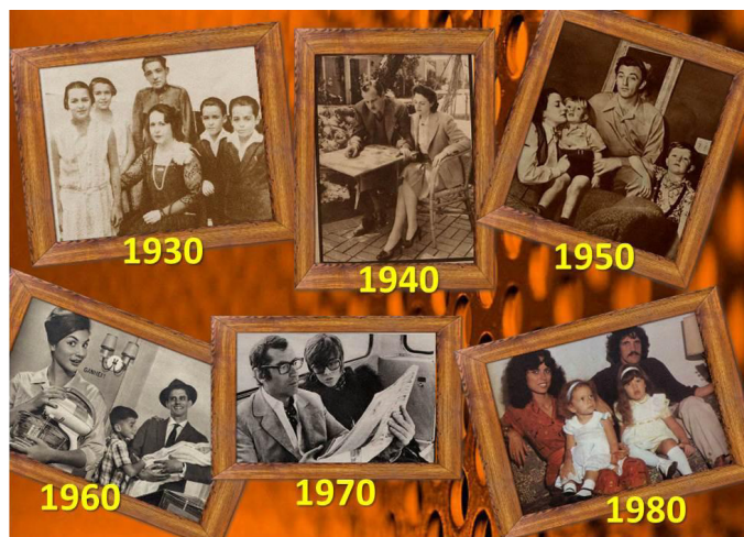
Figura 3 – Quebra-cabeça

Fonte: Resolução do Quebra-cabeça da página 15 da Oficina