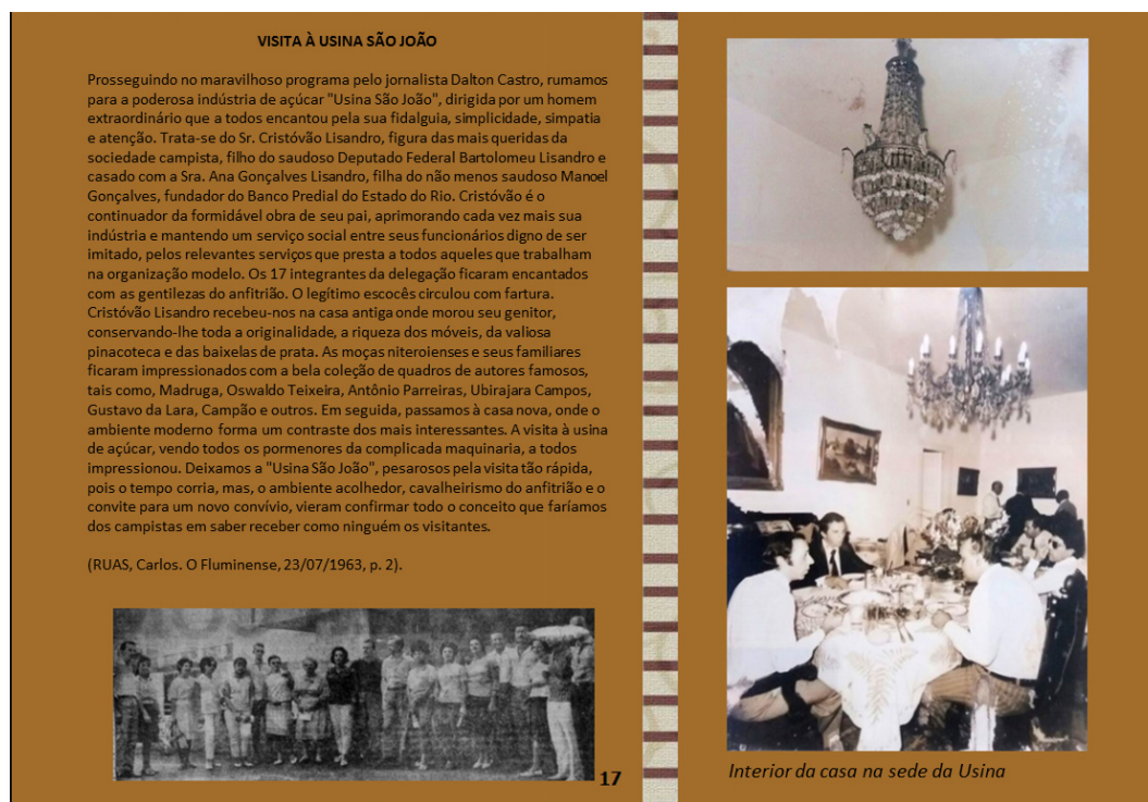
Figura 4 – Visita à Usina São João

As últimas fontes relacionadas ao modo de vida das elites (Figura 4) estão divididas em duas partes: uma reportagem que descreve o luxo da família Lysandro e duas fotos que retratam o interior da casa na sede da Usina, com destaque para os grandes lustres e para a organização da refeição e dos trajes utilizados pelos participantes.