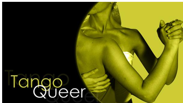
Imagen publicitaria del espacio en los últimos años.

Como decía, en los relatos analíticos sobre las trayectorias de las prácticas musicales pueden aparecer recorridos que van de la producción de contenidos opositivos y su declive posterior en virtud de la captura de la cultura hegemónica, que a cada paso va encontrando los recursos de acercamiento e incorporación de los elementos emergentes dándoles una función de uso a través de la replicación y el oscurecimiento de su confrontación simbólica. ¿Son los actores los que se ven sometidos a ese juego o es la escritura académica la que sitúa por fuera de su gesto los problemas de la dominación?