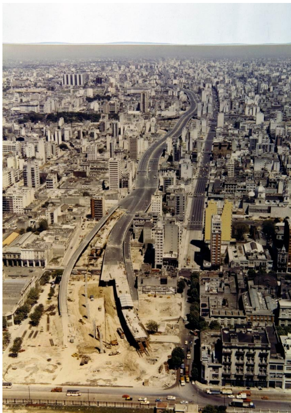
Figura 1. Documento fotográfico sobre la construcción de la Autopista 25 de Mayo y de cómo su trazado implicó el soterramiento del “Club Atlético”. Extraído de la web oficial del “Proyecto de Recuperación de la Memoria. CCDTyE “Club Atlético””: http://memoriaexatletico.blogspot.com.ar