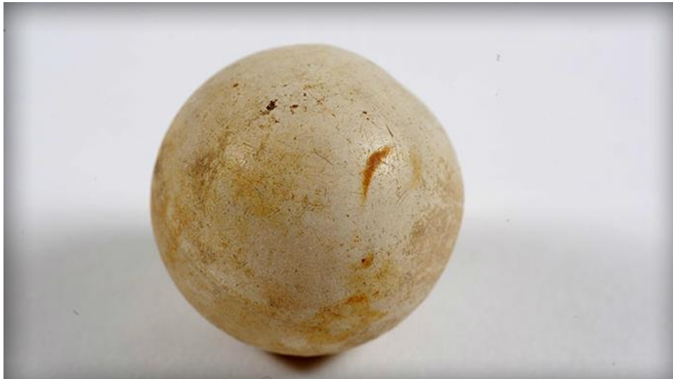
Figura 4. La pelotita de ping-pong hallada por medio de la excavación y trabajo arqueológico en “Club Atlético”.

curar un padecimiento implica poner el caos en estructura, volver conocido aquello que es desconocido. En el caso del ping-pong, el hallazgo de la pelota permitió darle referencialidad al sonido, poner en términos estructurales un hecho que generaba caos en las conciencias.