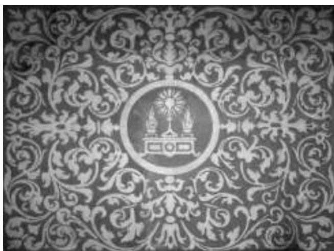
Fig. 7. Valencia. Iglesia de San Andrés, trasagrario.

En 1627, gracias al legado de Pedro Miralles y el apoyo del obispo Pedro Ginés de Casanova, se fundó en Segorbe el colegio de los jesuitas 41 . El elemento más interesante del conjunto es la caja de escalera rematada por una airosa cúpula sobre elevado tambor. Tanto la cúpula como las bóvedas en las que se sustenta aparecen profusamente decoradas con esgrafiados de yeso gris sobre fondo rosado que aparecen claramente fechados en 1632 [fig. 9]. La cúpula aparece dividida en secciones y en cada una de ellas un águila rodeada de roleos que rematan en una cesta de fruta, entre las ventanas del tambor los