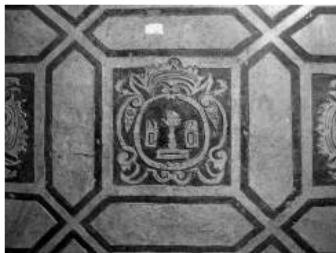
Fig. 8. Segorbe. Iglesia del convento de agustinas de San Martín, trasagrario, ca. 1621.