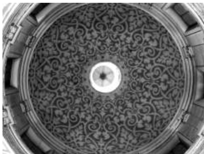
Fig. 4. Valencia. Antigua iglesia del convento del Carmen, capilla de comunión, 1613.

Por entonces, la presentación de muros y bóvedas faltos de decoración debía haber comenzado a ser considerada indecorosa. En el sagrario de Andilla se colocó un retablo aún conservado construido al parecer en 1640 por Gabriel Ximenez. El retablo está presidido por un gran relieve alusivo al Lavatorio de los pies, la escena está ambientada en una arquitectura centralizada con una bóveda de crucería en la que es posible ver tres claves y en donde cada uno de los plementos aparece decorado con una profusa decoración de roleos dorados [fig. 5]. En este caso es el estofado en madera el que reproduce la decoración esgrafiada o una decoración realizada en bronce como la del Panteón de El Escorial. Por entonces ya se empezaba a percibir el impacto de la decoración introducida en el Panteón por Giovanni Battista Crescenzi y en 1657 se iba a publicar la Descripción breve del Monasterio de San Lorenzo el Real del Escorial de Fray Francisco de los Santos que iba acompañado de once láminas grabadas por Pedro de Villafranca