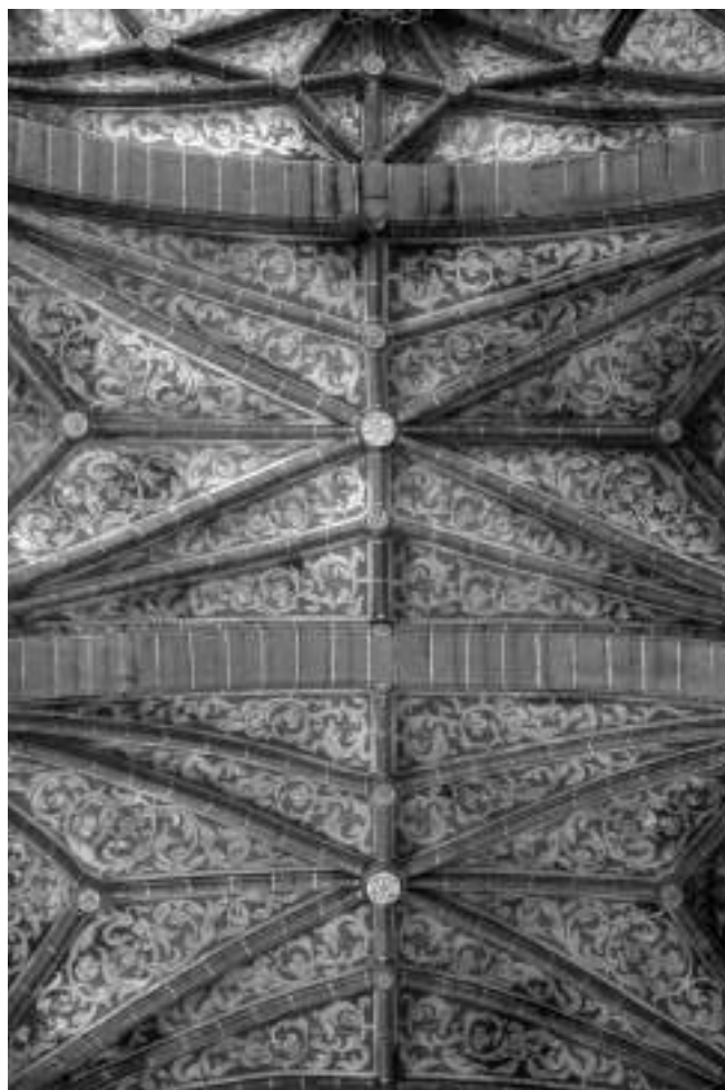
Fig. 12. Traiguera. Iglesia parroquial.