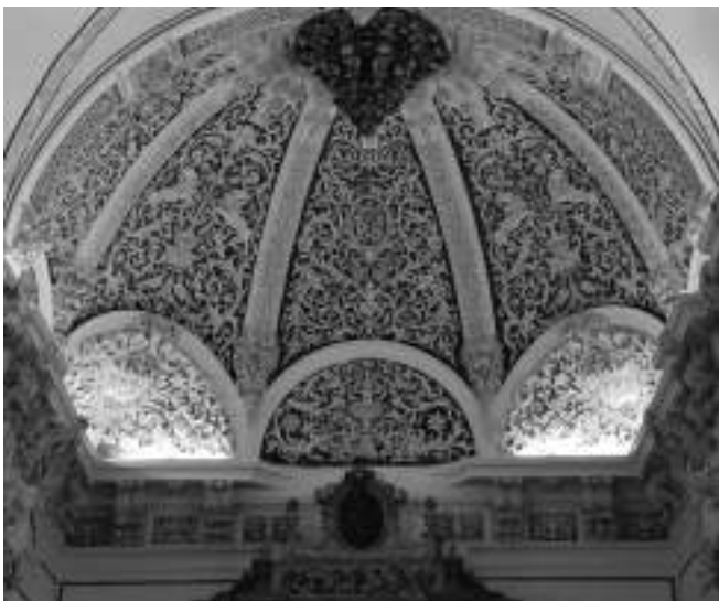
Fig. 10. Segorbe. Iglesia de San Joaquín y Santa Ana, antiguo convento de mercedarios, 1695.

Aunque pendientes de una catalogación pormenorizada, todo parece indicar que los esgrafiados aragoneses y catalanes son algo posteriores y probablemente influidos por los valencianos. Esto es evidente en el caso de los catalanes donde el esgrafiado triunfará fundamentalmente en el siglo XVIII en el revestimiento de fachadas. Uno de los primeros investigadores del tema, Nanot i Comas, señaló que el esgrafiado se iniciaba en Cataluña en los revestimientos de interiores para pasar luego a las fachadas