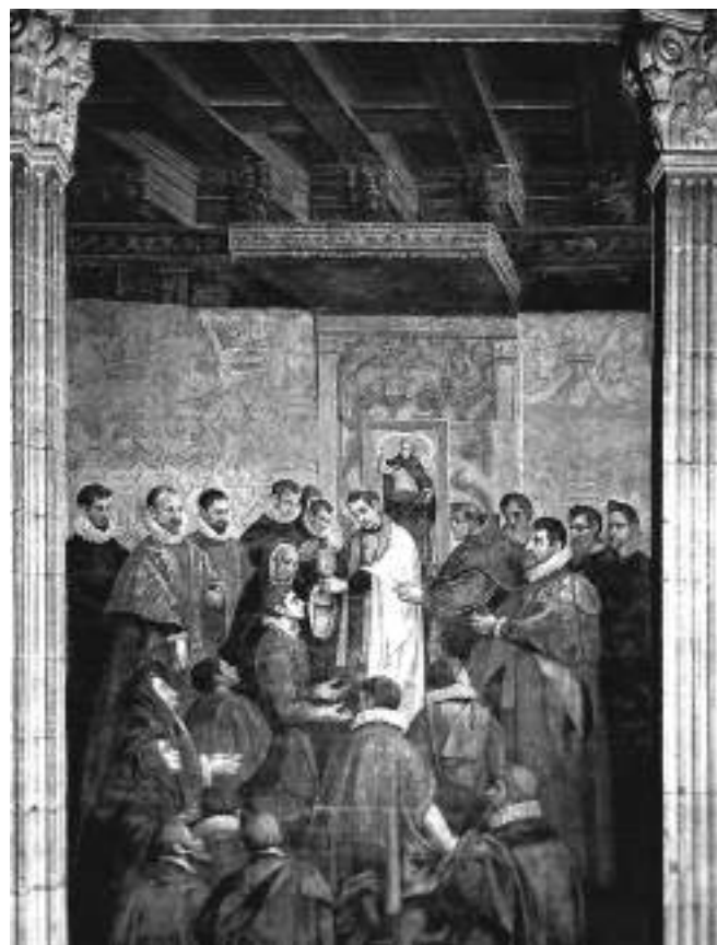
Fig. 2. Bartolomé Matarana, Veneración de la reliquia de San Vicente en Valencia , Valencia, capilla del Colegio del Corpus Christi.

santo. La frecuencia en el uso de estos tejidos decorativos debió provocar el intento de reproducir su apariencia de manera permanente. Ese es el caso de la decoración de muestras a manera de damascos en los muros del Palacio Real de Valencia realizadas por Miguel de Uruenya en 1573 27 . Al igual que sucederá con muchos de los ejemplos que nos ocupan estos muros con muestras o dibujos «a manera de damascos» estarcidos y bruñidos van asociados al uso en la parte inferior del muro de zócalos de azulejería que con una técnica diferente, más adecuada en el caso de superficies expuestas al roce y la humedad, realizan una función similar. Si en algunos casos los pavimentos de azulejería reprodujeron las afamadas alfombras de Mesina 28 , no es extraño que estas decoraciones reprodujeran los paramentos textiles que cubrían los muros de templos y palacios 29 . En la arquitectura religiosa y en el contexto de la Contrarreforma, este tipo de decoraciones podían tener también connotaciones salomónicas, haciendo alusión a las descripciones del velo del templo que hacen referencia a la presencia de querubines y vegetales 30 .