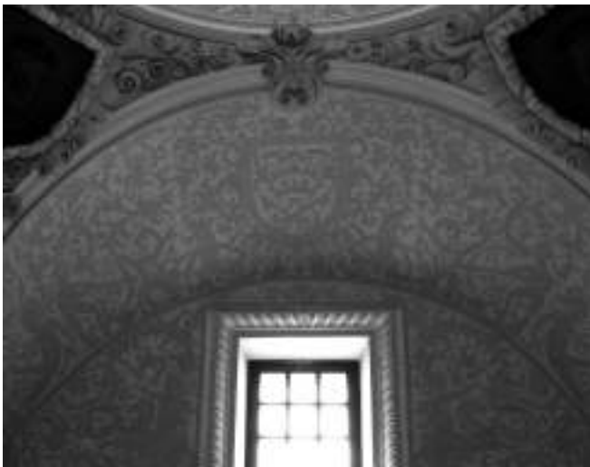
Fig. 9. Segorbe. Colegio de Jesuitas, cúpula de la caja de la escalera, 1632.

Los jesuitas parecieron especialmente proclives a este tipo de decoración, contemporánea a la cúpula segorbina debió ser la decoración de la desaparecida