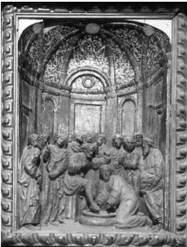
Fig. 5. Gabriel Ximenez, Lavatorio de los pies, 1640, Andilla, iglesia parroquial, retablo de la capilla del sagrario.

Otra de las fundaciones relacionadas con el Patriarca Ribera es el monasterio de agustinas recoletas de Santa Úrsula y las once mil vírgenes de Valencia. Según Teixidor el templo se terminó en 1645, en torno a esa fecha debió realizarse el trasagrario que ya responde al modelo que con más frecuencia será