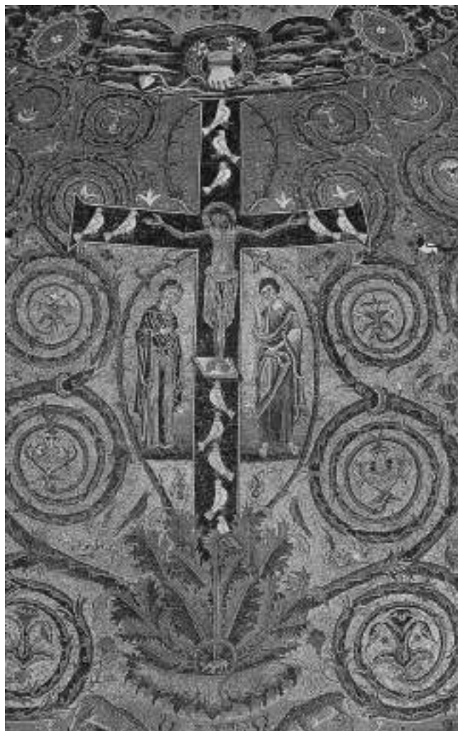
Fig. 1. Roma. Basílica de San Clemente, mosaico del ábside, siglo XII.