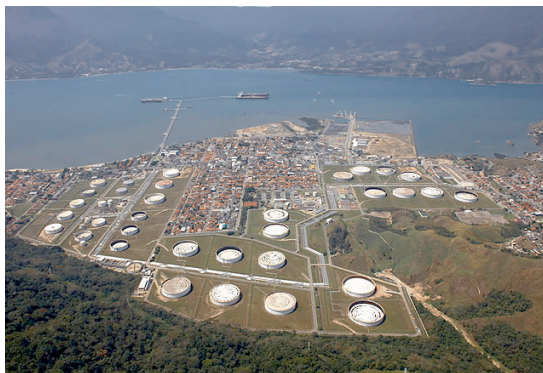
Fot. 1 - Terminal Marítimo Almirante Barroso - Tebar.

A cidade de São Sebastião, com 81.718 habitantes (IBGE 2014), situa-se no litoral norte (Estado de São Paulo), a 2,5 km de Ilha Bela e a 200 quilômetros ao leste da cidade de São Paulo. A cidade abriga o maior terminal de petróleo da América Latina, propriedade da empresa PETROBRAS, conhecida por TEBAR - Terminal Almirante Barroso, que recebe cerca de 50% de todo o petróleo que chega ao país. Os enormes tanques do TEBAR partilham o espaço com três distritos residenciais, com o centro histórico e o centro comercial da cidade (fot. 1).