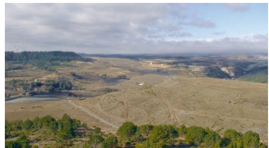
Fot. 6 - Colinas artificiais feitas do minério processado na Unidade de Combe du Saut: a polpa de minério é carregada com arsênico e cianeto. Abaixo, fluindo, o rio Orbiel.

Photo. 5 - Salsigne is one of the most polluted places in France.