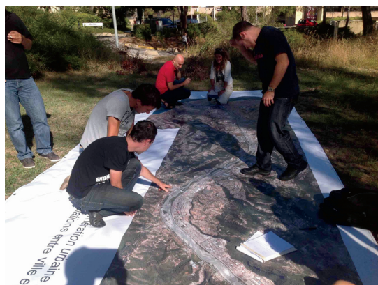
Fot. 7 - Quarta-feira, 18 de setembro de 2013, o dispositivo é testado em frente ao laboratório Géoazur. (Fonte: Jacques Lolive).

Para ilustrar estes métodos, propomos três exemplos. Os dois primeiros foram utilizados em um estudo realizado em 2013, na bacia do Vallée du Var, localizada no território da cidade de Nice, no sul da França e conduzidos por Jacques Lolive. A Carte de Gullive é um dispositivo de pesquisa participativa. Uma grande fotografia aérea da bacia do Vallée du Var, plastificada, de 8 metros por 3 (reprodução a grande escala 1/3000) é colocada ao ar livre. Os participantes são convidados a colocar os post-it (ou desenhar com giz indicações) na foto aérea para expressar suas reações e seus comentários. Algumas questões são colocadas como: Quais são os locais que eles apreciam? Quais são as transformações atuais? O rio (no caso, da Bacia Vallée du Var) é perigoso? (fot. 7).