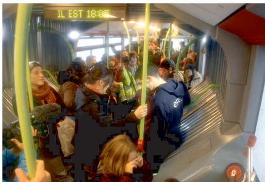
Fot. 3 - Jour inondable: Le concert de sirènes.

O concerto de sirenes (le concert de sirènes, fot. 3) . É anunciado a evacuação dos habitantes de Tours pois esta será inundada. A Defesa Civil embarca as pessoas em um ônibus para levá-las em um lugar seguro. Neste ônibus, as janelas foram “embaçadas” para que as pessoas não pudessem ver o que acontecia do lado de fora. Dentro do ônibus, um alto-falante transmitia o som de sirenes, sons de alerta e uma leitura do Plano de Salvaguarda da cidade (planejado pelos atores das ações ordinárias em caso de catástrofe). Foi uma criação sonora assustadora que informava como os dispositivos de gestão de emergência se colocavam em ação.