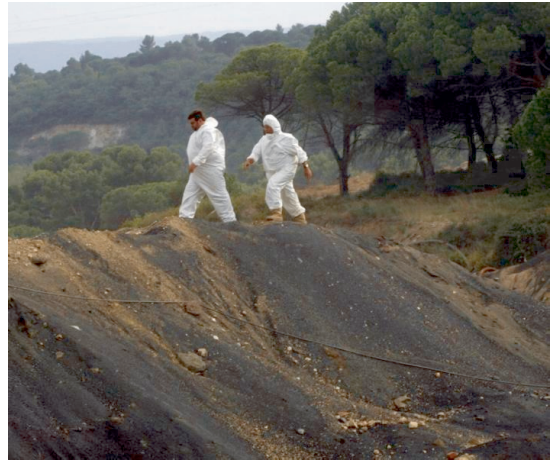
Fot. 5 - Salsigne fica em um dos lugares mais poluídos na França.