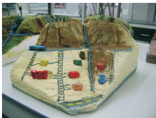
Fot. 3: Encosta com ocupação em área de risco.

A oficina compreende trabalhos manuais e discussões constantes sobre o assunto representado e sobre a técnica de produção de maquetes a partir de curvas de nível. Para isso são necessários carta ou recorte topográfico da área a ser representada e materiais como: lâminas de isopor ou outro material como papelão (0,5 cm), tesoura, cola, estilete, vela, cola para isopor, massa corrida, tinta guache, serragem, espuma, palitos e outros.