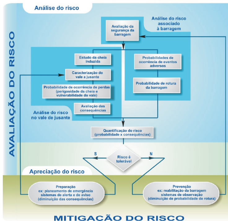
Fig. 1 - Gestão do risco nos vales a jusante de barragens (Fonte: T. VISEU, 2006).

Na Eq. 2, N representa as perdas, ou seja, por exemplo, o número total de vidas em exposição. P(N/\text{rotura}) é a probabilidade condicionada da ocorrência de N perdas dado que ocorreu a rotura da barragem.