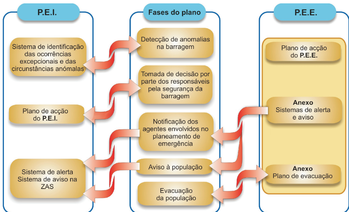
Fig. 4 - Relação entre o PEI, o PEE e as fases de emergência associadas ao risco nos vales a jusante de barragens (Fonte: T. VISEU, 2006).

Com efeito, de acordo com a legislação em vigor, verifica-se que o Dono da Obra não tem responsabilidade nem