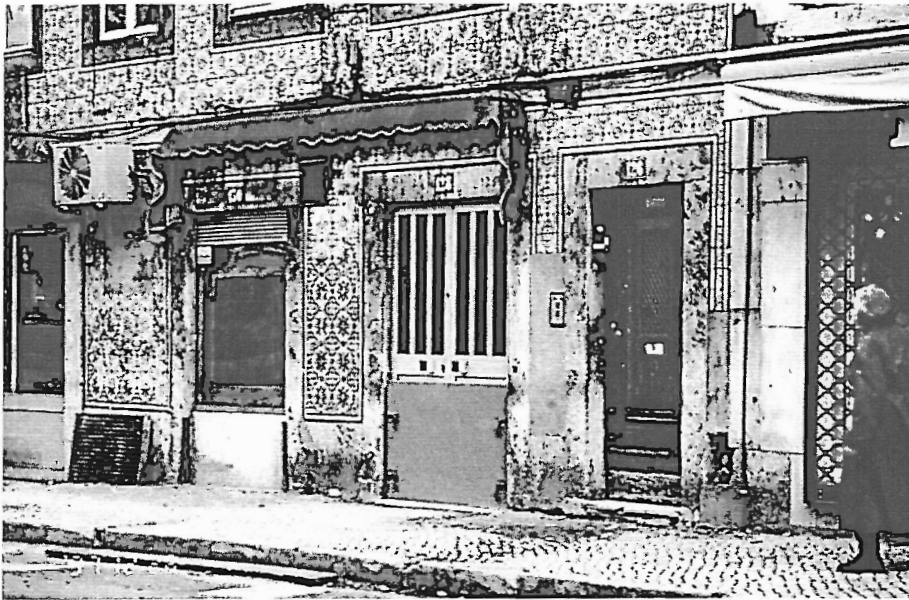
Fot. 2 - Casas com protecções contra pequenas cheias numa rua de Alcântara.

nem foi precisa tanta chuva para os problemas em certos locais serem ainda mais graves.