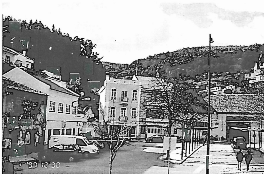
Fot. 3 - Casas do centro de Monchique já recuperadas da inundaç o, mas mantidas no mesmo local, sobre o leito da ribeira.

os solos, muito provavelmente ainda hidrof bicos, n o permitiriam a infiltra o. Por outro lado, que esperar do efeito de barragem das casas construidas sobre duas das ribeiras mais violentas? L a est o as casas de dois pisos, relativamente recentes no centro da vila (fot. 3) e os j  velhos edif cios das Caldas (fot. 4) tr s quil metros adiante, cortando perpendicularmente as linhas de  gua em que as instalaram. Os cursos de  gua foram canalizados por baixo delas e o resultado esteve   vista de todos – entulhamento das manilhas, barragem das  guas, entrada das  guas caudalosas por baixo ou por cima e sa da pela frente com todo o recheio das respectivas casas.