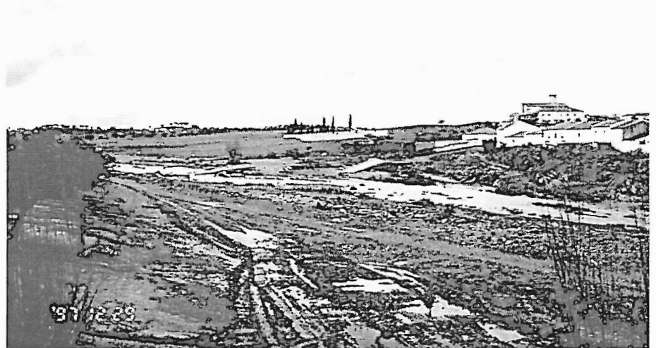
Fot. 5 - Ponte destruída em Albernoa.

Aparentemente, os declives fracos do Alentejo não seriam favoráveis a grandes velocidades de escoamento; no entanto, verificou-se uma rápida resposta dos pequenos cursos de água, em especial nas áreas de maiores declives, e a sua violência esteve também relacionada com a viscosidade. Na verdade, a água mobilizou elementos dos solos muitas vezes sem protecção de coberto vegetal, fosse por causa de incêndios florestais ou de mato, particularmente no caso do município de Aljezur (situado no Algarve, mas confrontando com o Alentejo), onde os incêndios de 1995 ultrapassaram os 5000 ha de área ardida,