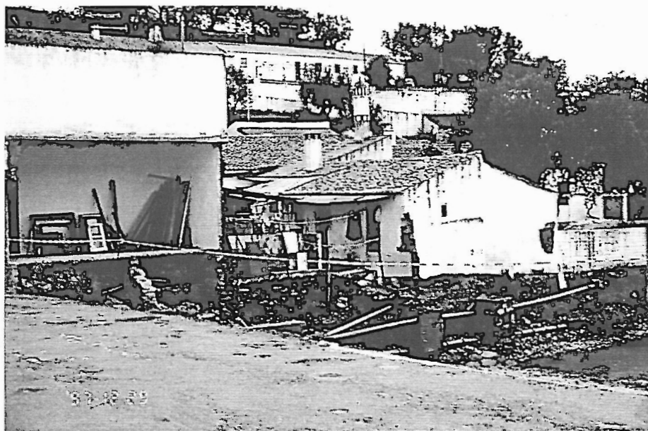
Fot. 6 - Garvão – casas destruídas pela cheia junto ao canal igualmente afectado. Fotografia tirada de cima da ponte, também em parte destruída.

fosse por causa dos trabalhos agrícolas, em especial no respeitante às vinhas onde, em regra não se respeitam as curvas de nível, fosse, ainda, devido à secura dos terrenos agravada por plantações de eucaliptos. Pareceu-nos também que muitas barragens não funcionaram pelo simples motivo da perda de capacidade das suas albufeiras. Além disso, a construção de casas, de ruas e de pontes sobre leitos de inundaçãõ ou no interior da linha limite das cheias centenárias (fot. 5) veio aumentar a vulnerabilidade em muitos locais; num caso (Garvão), a impermeabilizaçãõ de um curso de água, canalizado a céu aberto no meio da povoaçãõ terá igualmente contribuído para dar uma sensaçãõ de segurança que, devido ao rápido trabalho de sapa em ligeiras fragilidades, acabou por agravar os prejuizos materiais (fot. 6).