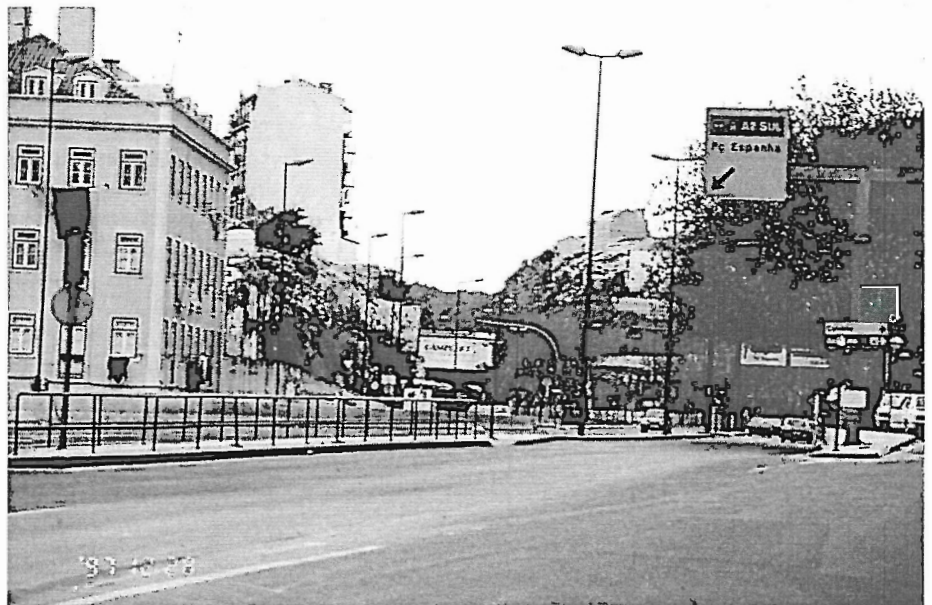
Fot. 1 - Aspecto da parte terminal do canal de escoamento da “torrente” de Alcântara.

Infelizmente, ainda a cidade não estava refeita das inundações de 18 de Outubro e já tinha novas inundações no dia 20, que se repetiram a 2 de Novembro;