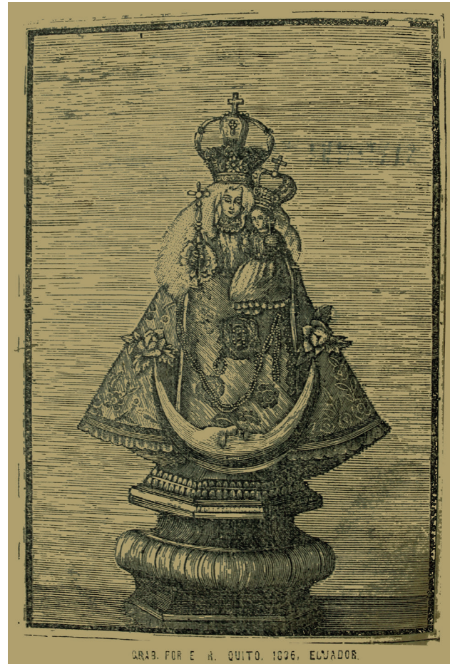
Figura 1. La Virgen del Quinche

Fuente: Biblioteca del Ministerio de Cultura, Carlos Sono. 1895. Novena a la Santísima Virgen del Quinche . Quito: Imprenta del Clero, JJ008519, 2.