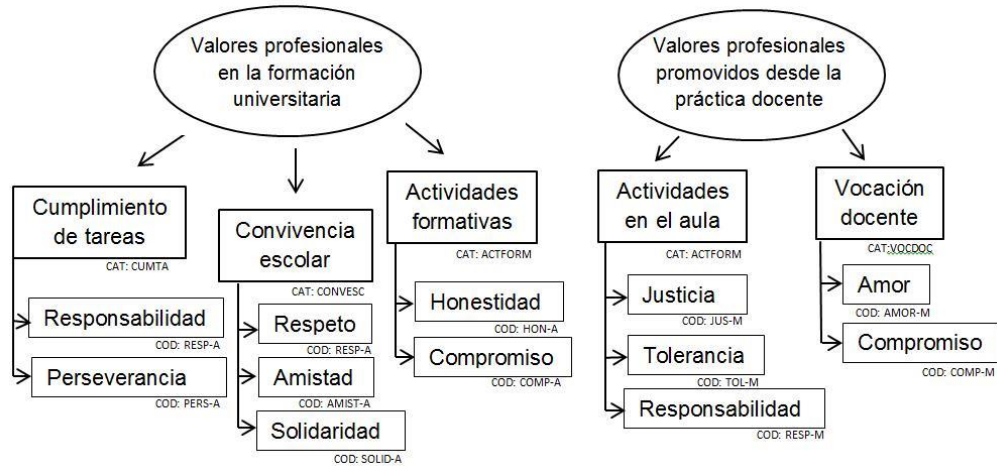
Figura 1. Pregunta 1. Dimensiones, categorías y unidades de análisis

Otra de las aportaciones significativas del grupo focal fue asumir que la participación de los estudiantes en el aula es activa y a la vez diversa, y ésta se da en situaciones positivas de convivencia: