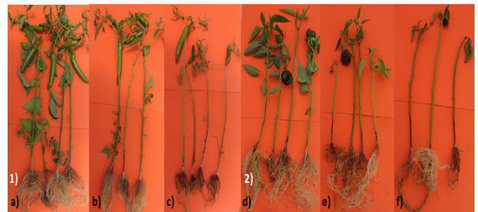
Figura 2. Aspecto general del grado de severidad de la marchitez causada por Phytophthora capsici en plantas de chile serrano (1) y poblano (2) a los 95 DDI bajo condiciones de invernadero. Cerro del Metate (nivel 1: a y d); sin HMA (nivel 3: b; nivel 4= f); El Huizachal (nivel 5= c); Paso Ancho (nivel 3= e).

La síntesis de fitoalexinas está documentada como una respuesta de la planta al ataque de fitopatógenos donde se encuentran implicados el ácido jasmónico y el etileno que