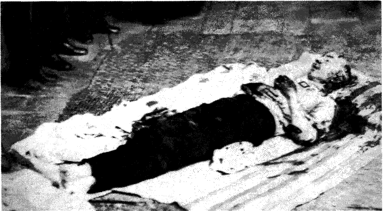
Fotografía del cadáver del presidente García Moreno captada por Rafael Pérez

1875 y a quien el mismo Pérez retratará para sus tarjetas personales de visita y en otras ocasiones tanto en Guayaquil, como en Quito). Las mismas fotos que Pérez tomó para las postales del presidente fueron utilizadas para la ceremonia de procesión de su funeral.