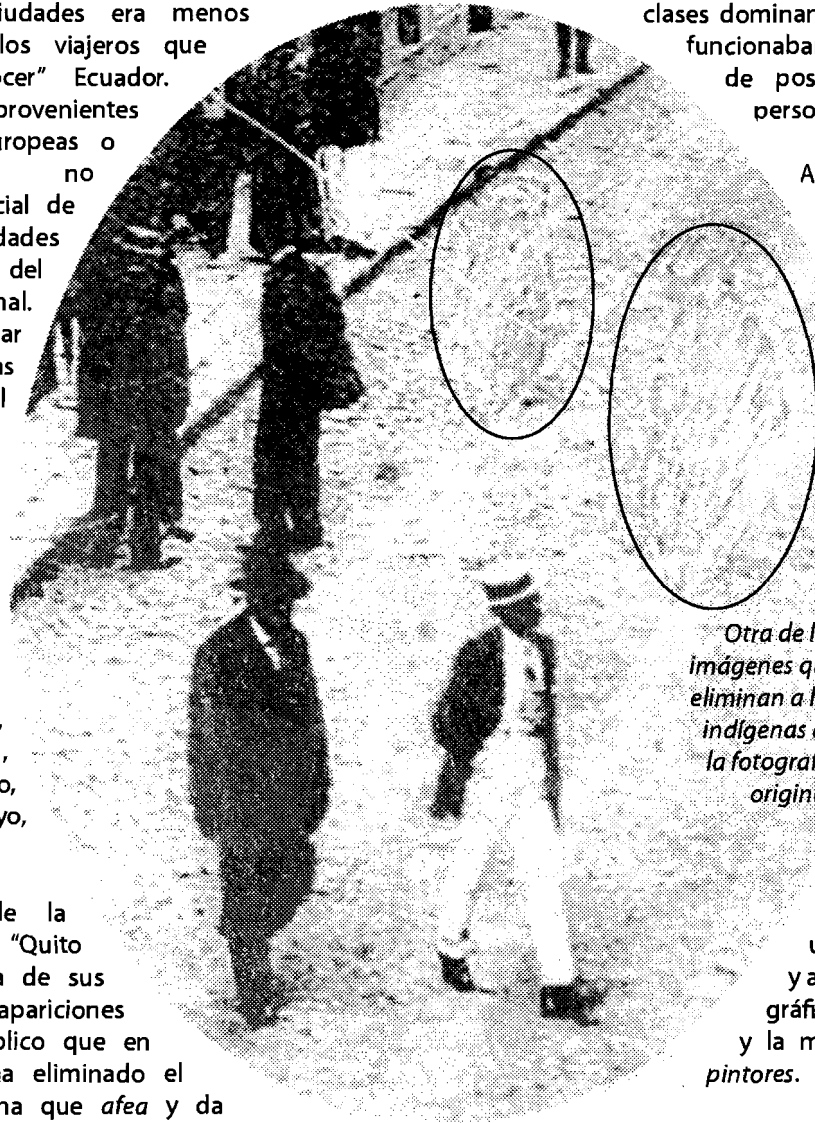
Otra de las imágenes que eliminan a los indígenas de la fotografía original.

La mayor parte de estas tarjetas llevaban el nombre del fotógrafo que las imprimió o de su estudio (en algunos casos en anverso y reverso). Este uso de la fotografía tuvo como fin principal el envío de recuerdos de las clases dominantes, y en algunos casos funcionaban como una especie de postales o breves cartas personales.