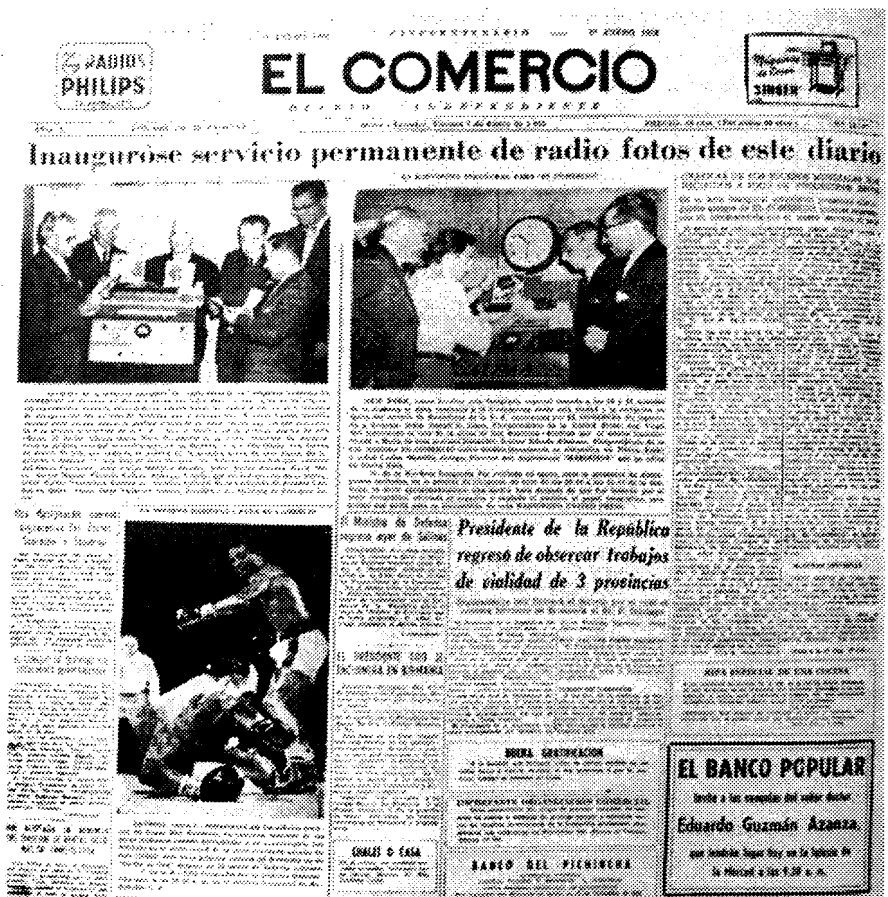
Publicación de El Comercio de 1955

"Ya en 1960 las ediciones de El Telégrafo alcanzan 40 páginas que contienen 50 fotografías, algunas en acción, 75% originadas en Quito y 25% de información internacional. En el mismo año, El Universo puede mostrar unas setenta fotografías, 80 por ciento de las cuales corresponden a producción local, aunque muchas no son más que retratos posados provenientes del archivo