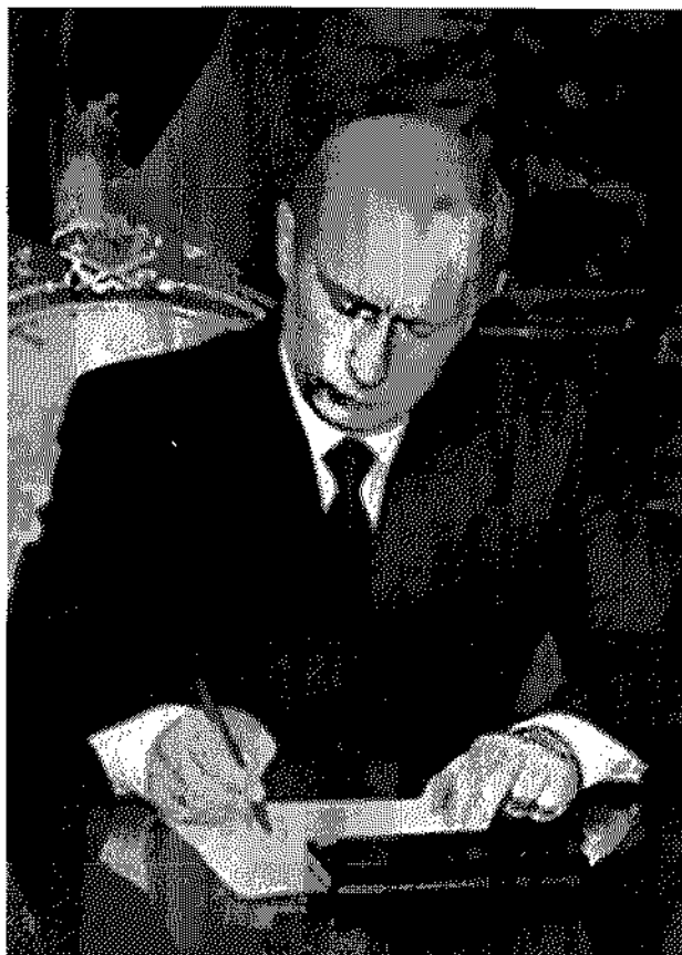
Putin asume el 7 de mayo del 2000

Votápek resalta algo que no podemos pasar por alto: hoy en día y desde que se desmoronó la Unión Soviética, los rusos se preocupan por comer y vestirse. Conceptos abstractos distantes de esos, carecen de sentido. El presidente checo, Vaclav Klaus (un economista conservador), ha comentado sobre el tema de la democracia y las libertades que éstas se apoyan y desarrollan, pero no se imponen, mucho menos por la vía de la guerra. ●