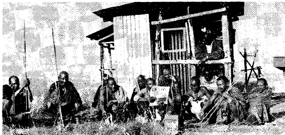
Indígenas Masai, Africa: pasivos receptores y consumidores de las "verdades"...

Finalmente, vale consignar algunas propuestas sobre temáticas que a criterio individual de los autores del Informe MacBride deberían ser motivo de estudios más profundos como la interdependencia de los intereses de los países pobres y ricos , la formulación de una legislación internacional en materia de comunicación , en especial la idea de un código internacional de deontología , los efectos sociales, económicos y culturales de la publicidad y el problema comunicacional de las desatendidas zonas rurales . Aunque estas sugerencias no fueron aprobadas por la Comisión, son no obstante un reflejo de la amplitud de las reflexiones que enriquecieron el debate en torno a la elabora-