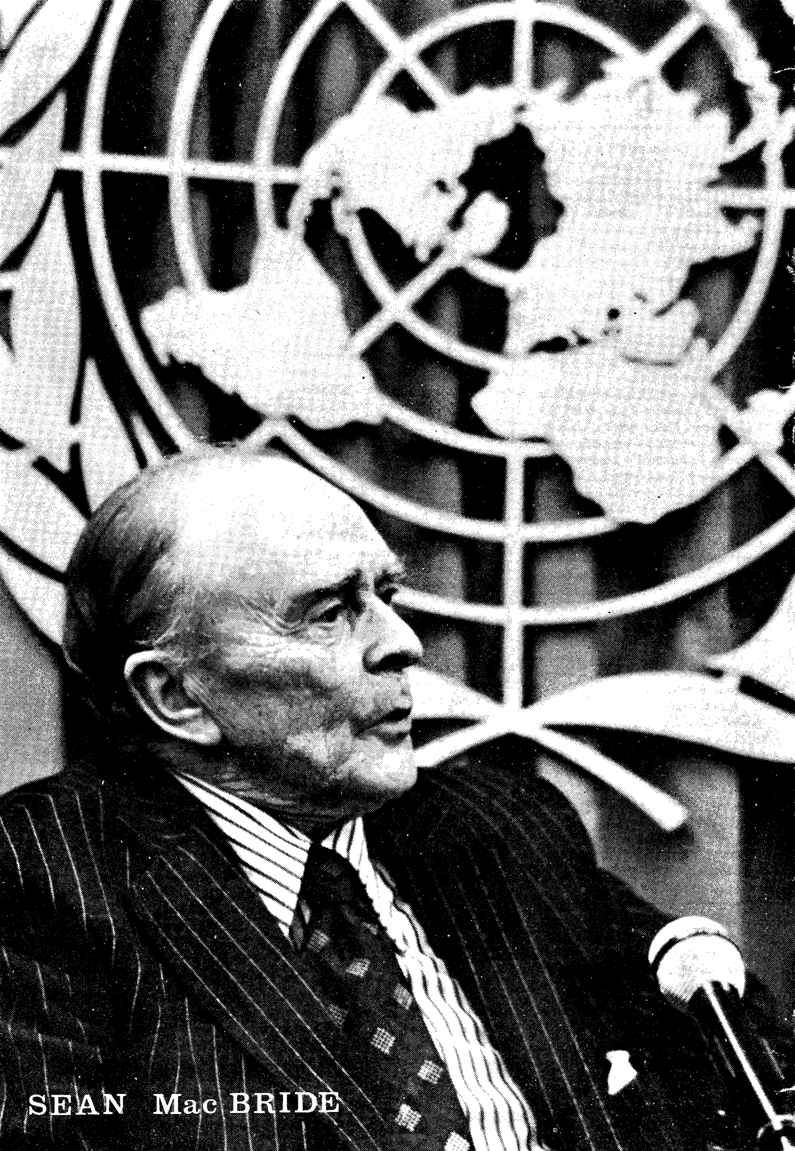
SEAN Mac BRIDE