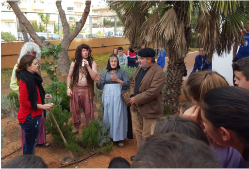
Visita del Grup de Teatre des Cubells

eivissenques que ens cedeixen els seus productes de la terra (vi, formatge, embotits, oli, orelletes, magdalenes...) podem agrair d'alguna manera la seua feina.