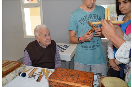
Exposició d'instruments i juguerois de l'associació Es Retorn

Podeu veure les activitats que s'han fet fins ara a la Setmana de la Terra al blog: setmanadelaterra.blogspot.com