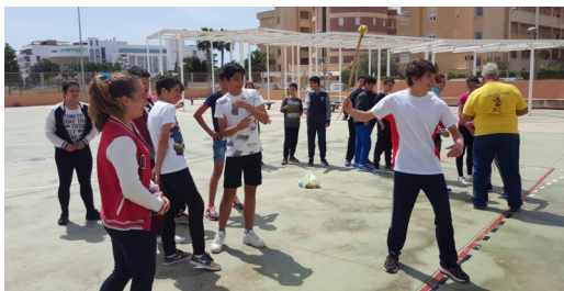
Taller de tir amb bassetja

Un altre taller que es repeteix cada any és el de tir amb bassetja, destinat a l'alumnat de 2n d'ESO. La bassetja és una antiga arma eivissenca, eina de pastors i jugueroi d'infants. Avui en dia, tirar-la s'ha convertit en un esport, esport que aprenen a practicar els nostres alumnes amb pilotes de tennis gràcies als instructors de la Federació de tir amb bassetja. És una activitat que els agrada molt.