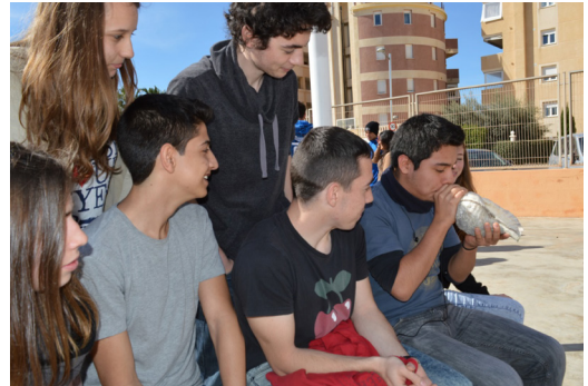
Taller de brular corns

Tampoc no ha faltat mai la visita dels membres de la Federació de criadors del ca eivissenc que expliquen als nostres alumnes la història i les característiques d'aquest ca. La trobada amb els cans sempre ens deixa imatges molt tendres i especials.