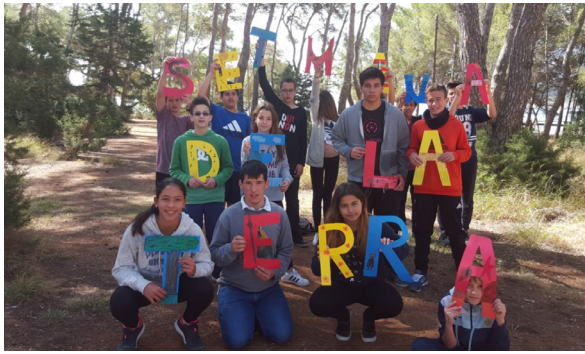
Preparació de la Setmana de la Terra

La Setmana de la Terra és un projecte obert a les propostes i idees del professorat, per tant cada professor o departament pot decidir com hi vol participar, què hi vol aportar. Les activitats poden tenir molts formats i durades diferents. L'única característica comuna que es demana a totes les propostes és que estiguin relacionades amb el patrimoni històric, cultural i natural d'Eivissa. Totes les activitats es duen a terme en català, excepte les proposades pels departaments de castellà i llengües estrangeres.