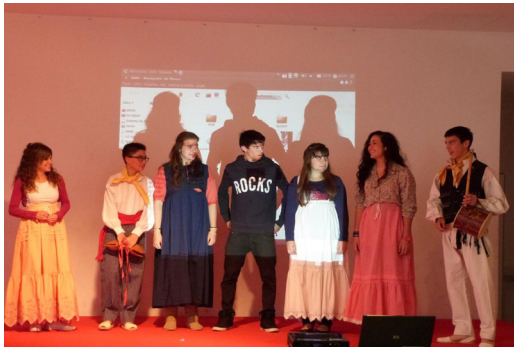
Taller de ball pagès

La segona activitat que es manté des del primer any és el taller de ball pagès, el ball tradicional d'Eivissa, també dirigit a l'alumnat de 1r d'ESO. El taller és impartit pels alumnes del centre que saben ballar i que van a les classes dels seus companys a ensenyar-los-en. El darrer dia de la Setmana de la Terra es convida la colla de ball pagès del poble, la colla des Broll, i es fa una gran ballada. Gràcies a aquesta activitat alguns dels nostres alumnes ballen avui amb aquesta colla.