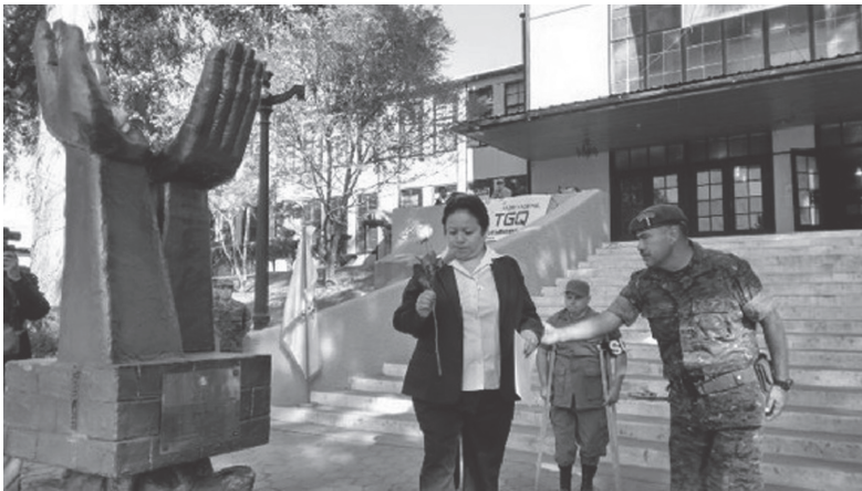
Foto 4. Cambio de la rosa de la paz en Quetzaltenango.