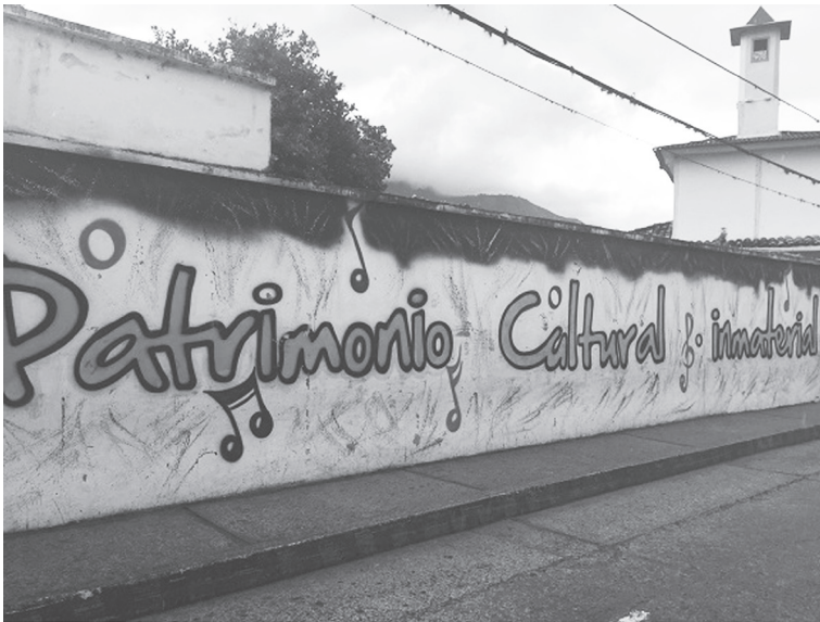
Foto 1. Mural Concurso Departamental de Bandas Musicales, Samaniego, Nariño.