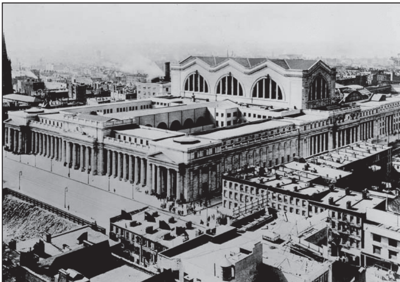
ILUSTRACIÓN 2: ANTIGUA ESTACIÓN DE PENSILVANIA EN LA CIUDAD DE NUEVA YORK.